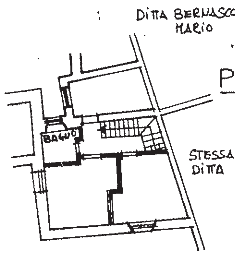
PIANO PRIMO H= 2,70