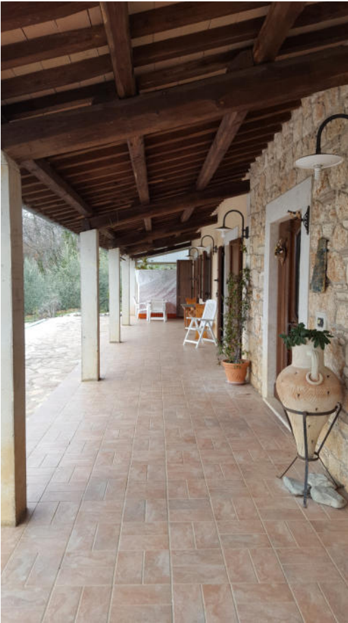
Foto 4 - Vista del portico