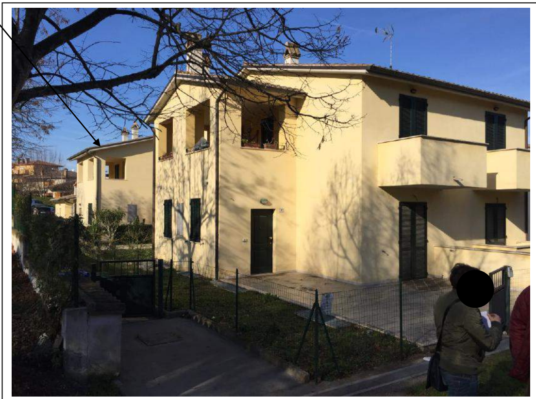
Abitazione in oggetto