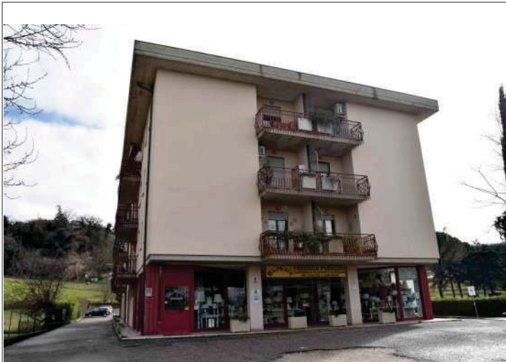
Esterno: prospetto lungo via Tiberina Sud