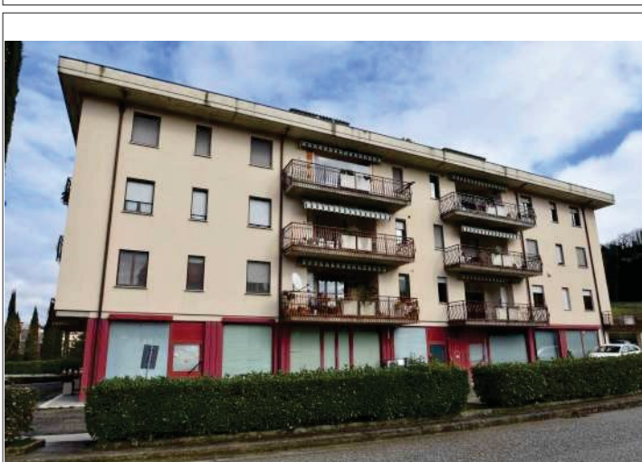
Esterno: prospetto Sud-Ovest