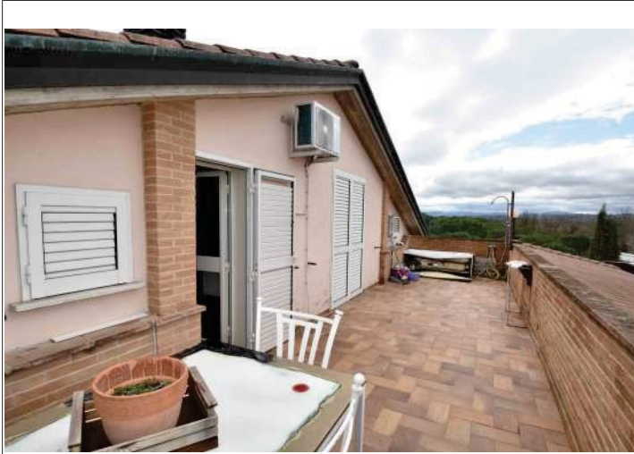
Terrazza su via Tiberina Sud esposta a Nord