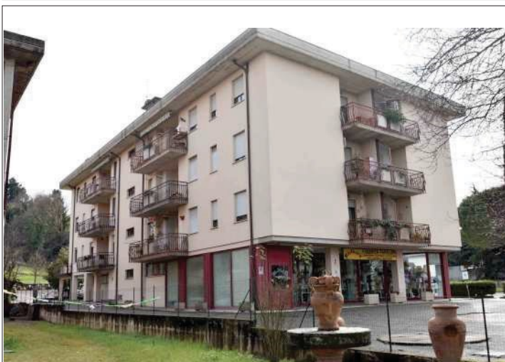
Esterno: prospetto lungo via Tiberina Sud