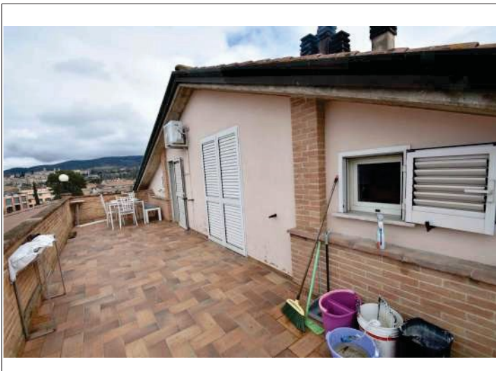
Terrazza su via Tiberina Sud esposta a Nord