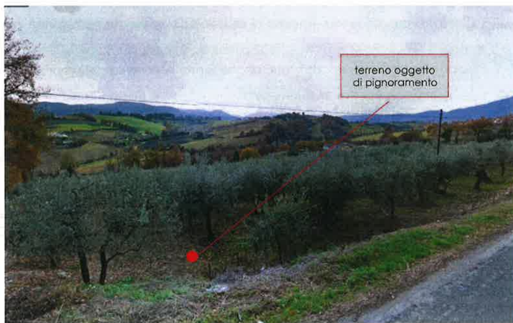
vista da via S. Silvestro