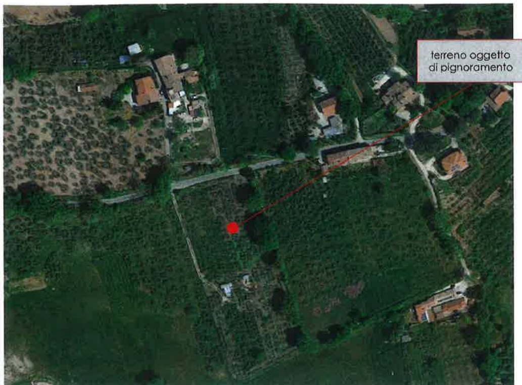
vista aerea del terreno identificato al N.C.T. del Comune di Spoleto al foglio 110 particella 674