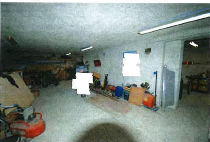
Interno - garage