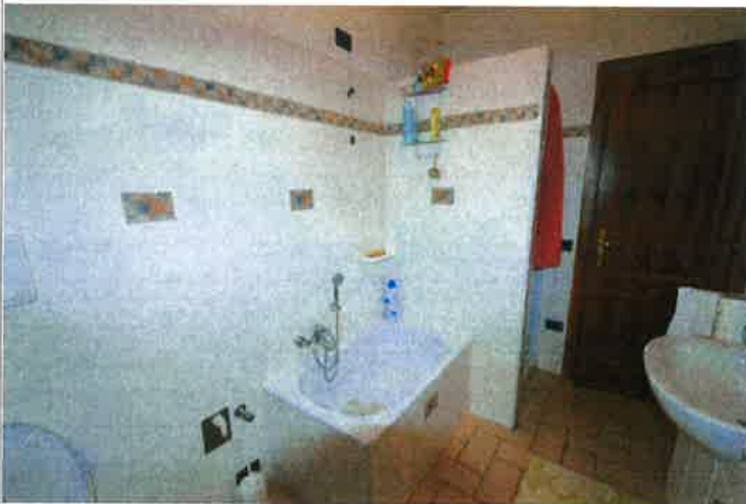
Interno - bagno