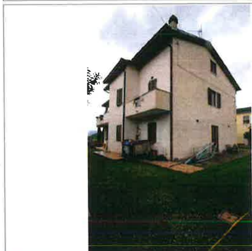
Esterno - prospetto laterale, lato Nord-Ovest