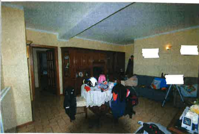
Interno - soggiorno/pranzo