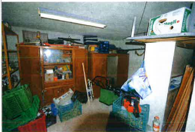
Interno - fondo 1