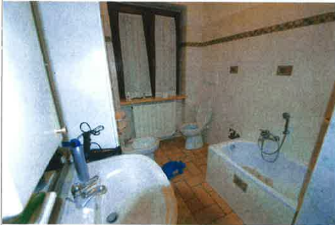
Interno - bagno