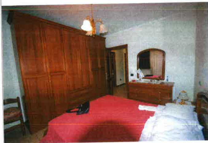
Interno - camera