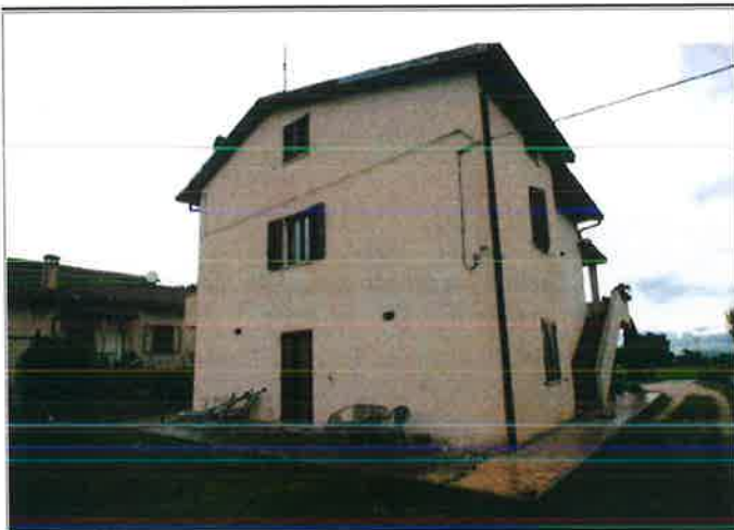
Esterno - retro prospetto, lato Sud-Ovest