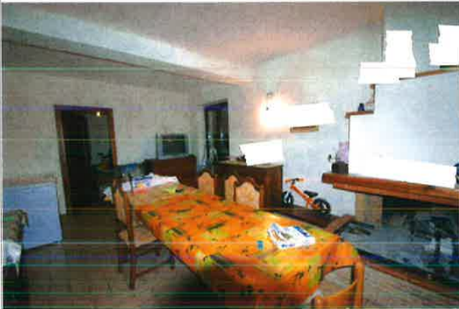
Interno - taverna