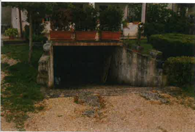
Esterno - ingresso interrato (garage)