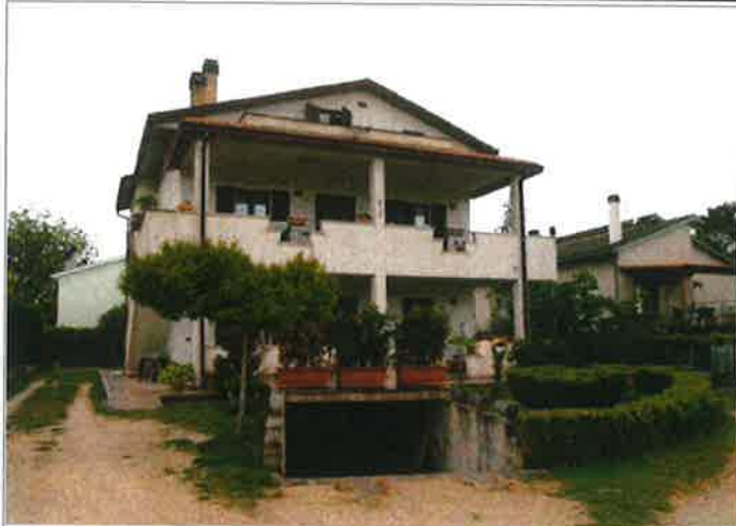
Esterno - prospetto principale, lato a Nord-Est