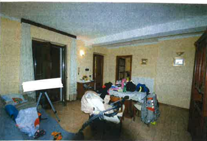
Interno - soggiorno/pranzo