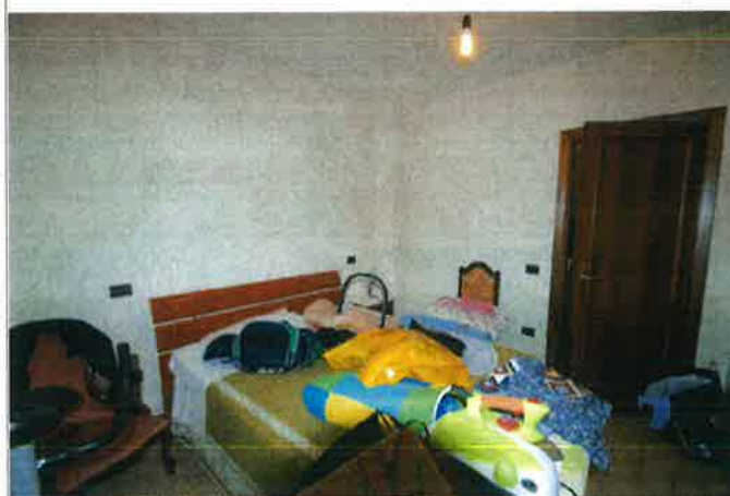
Interno - cantina