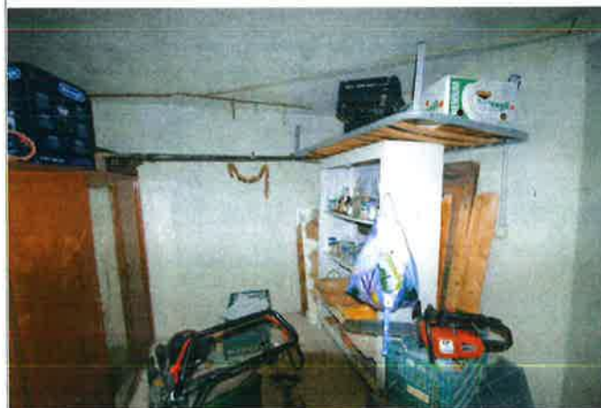
Interno - fondo 1