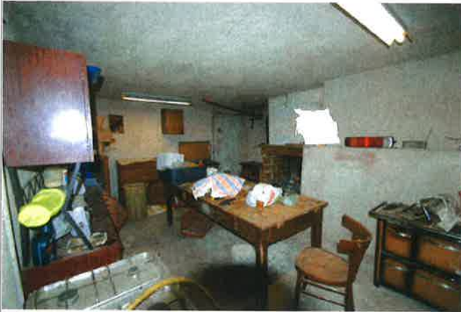
Interno - fondo 2