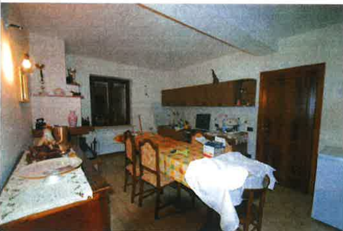
Interno - taverna