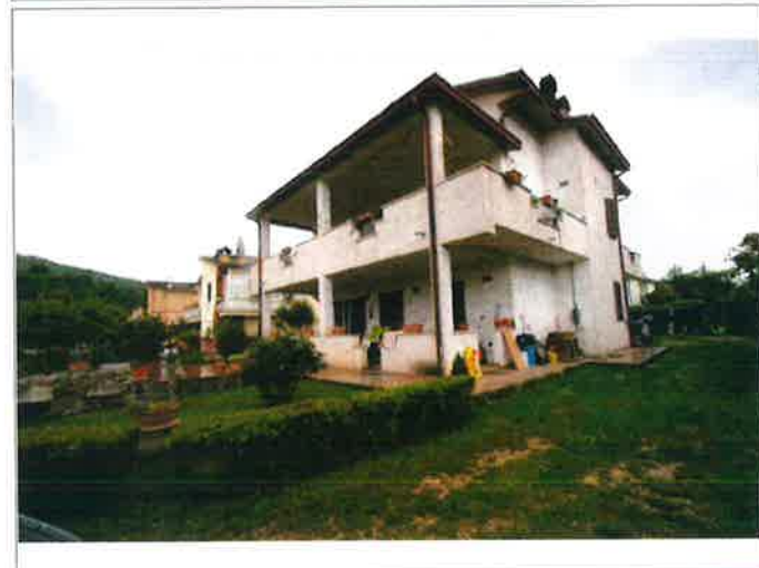
Esterno - prospetto principale, lato a Nord-Est