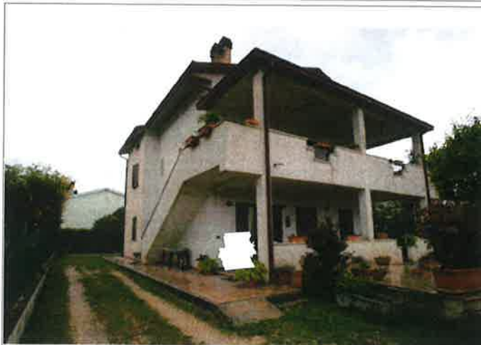
Esterno - prospetto laterale, lato Sud-Est