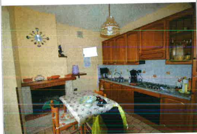
Interno - cucina