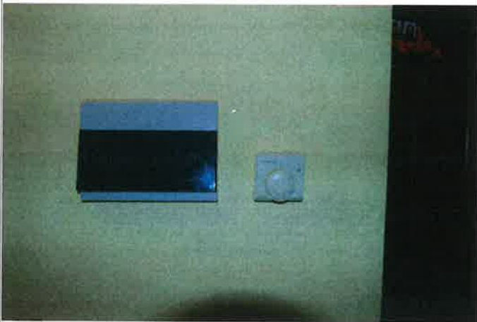
Termostato, impianto termico indipendente, caldaia interna