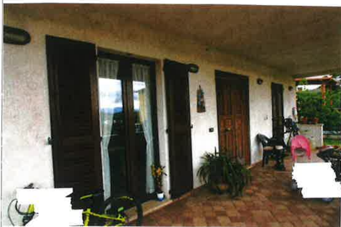
Esterno - portico, ingresso appartamento piano terra