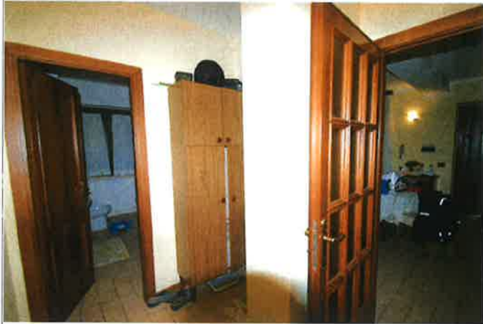
Interno - disimpegno