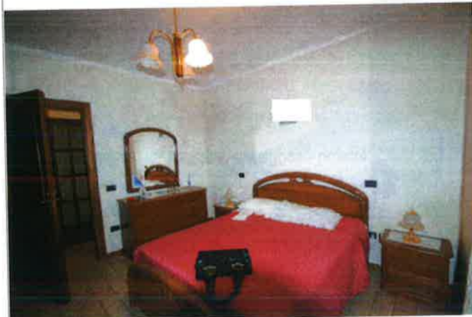
Interno - camera