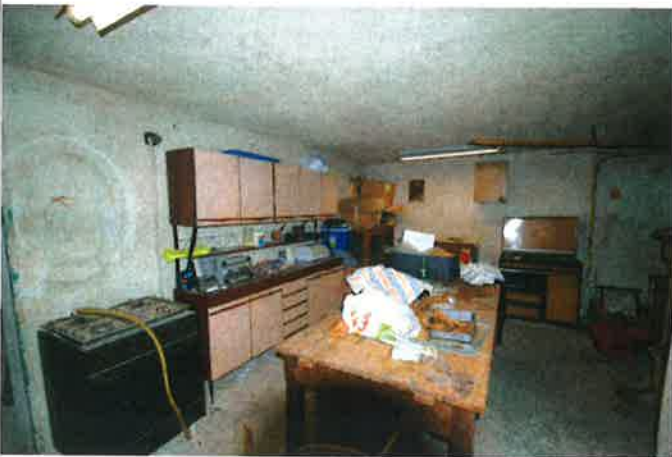
Interno - fondo 2