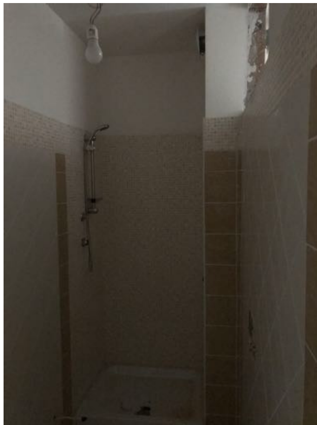
Piano Terra Immobile in corso di costruzione – Todi