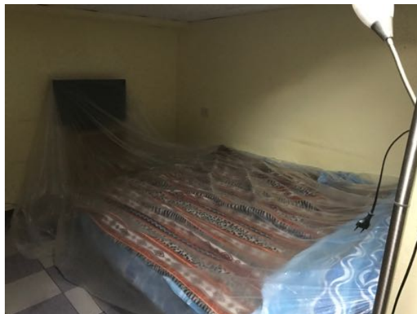
Mansarda/Magazzino sito in Via Settevalli – Perugia