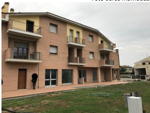
Esterno Immoblie in corso di costruzione – Todi