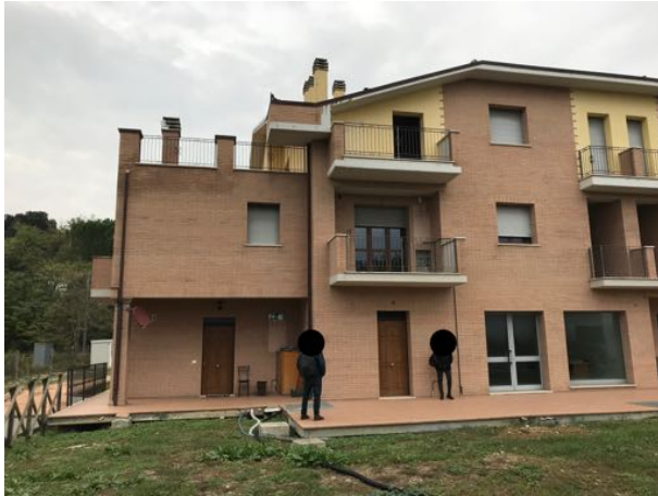
Esterno Immobile in corso di costruzione – Todi