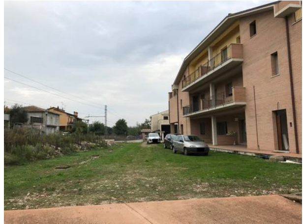
Esterno Immobile in corso di costruzione – Todi