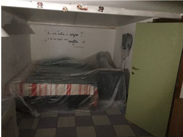
Mansarda/Magazzino sito in Via Settevalli – Perugia