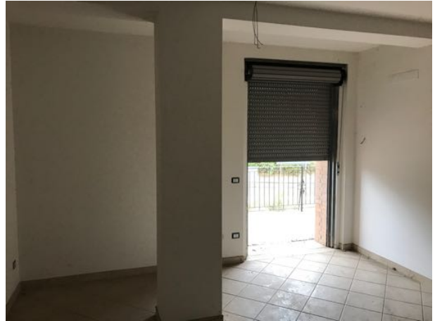
Piano Primo Immobile in corso di costruzione – Todi