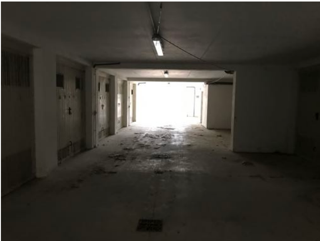
Piano Seminterrato Immobile in corso di costruzione – Todi