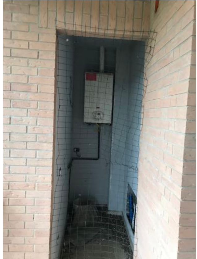
Piano Primo Immobile in corso di costruzione – Todi