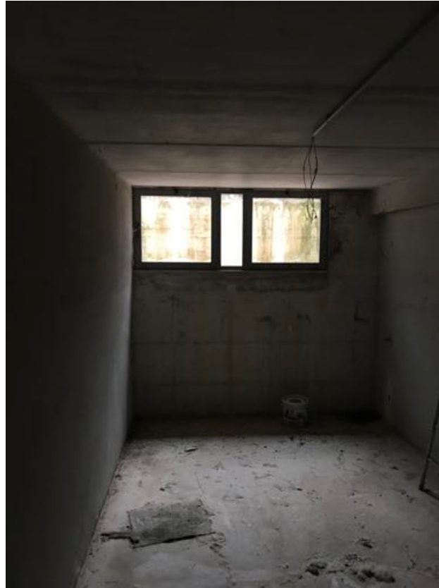
Piano Seminterrato Immobile in corso di costruzione – Todi