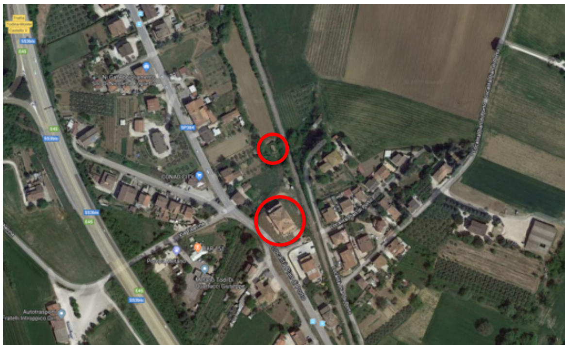
Foto aerea individuazione immobili siti in Todi