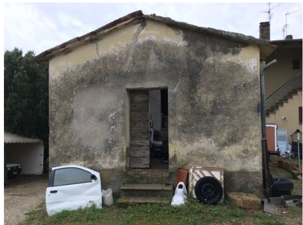
Immobile sito in Via Fratelli Cervi – Fratta Todina