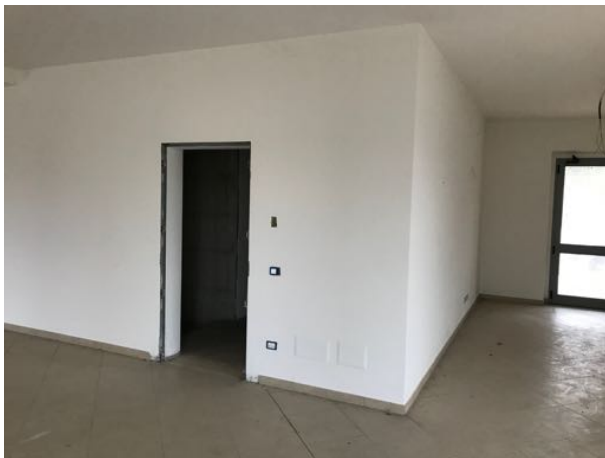
Piano Terra Immobile in corso di costruzione – Todi