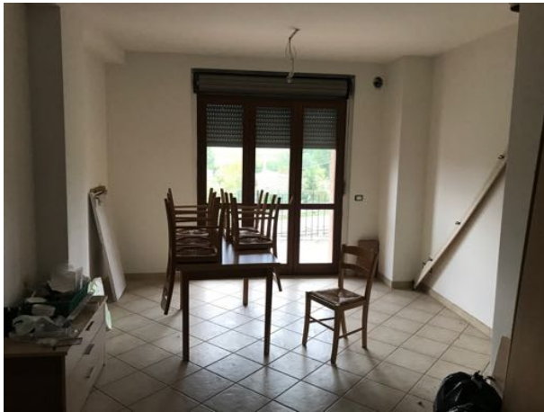
Piano Primo Immobile in corso di costruzione – Todi