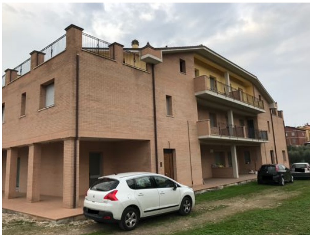
Esterno Immobile in corso di costruzione – Todi