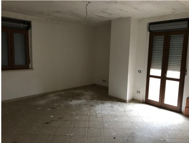
Piano Primo Immobile in corso di costruzione – Todi