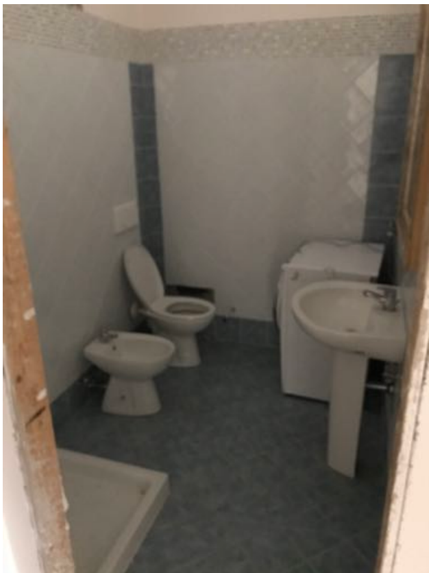
Piano Terra Immobile in corso di costruzione – Todi