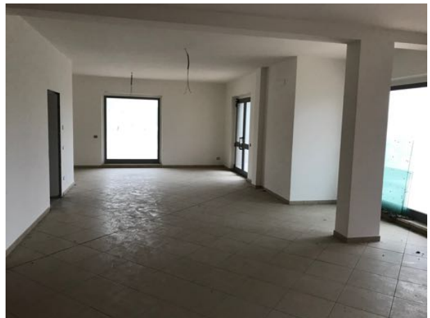
Piano Terra Immobile in corso di costruzione – Todi