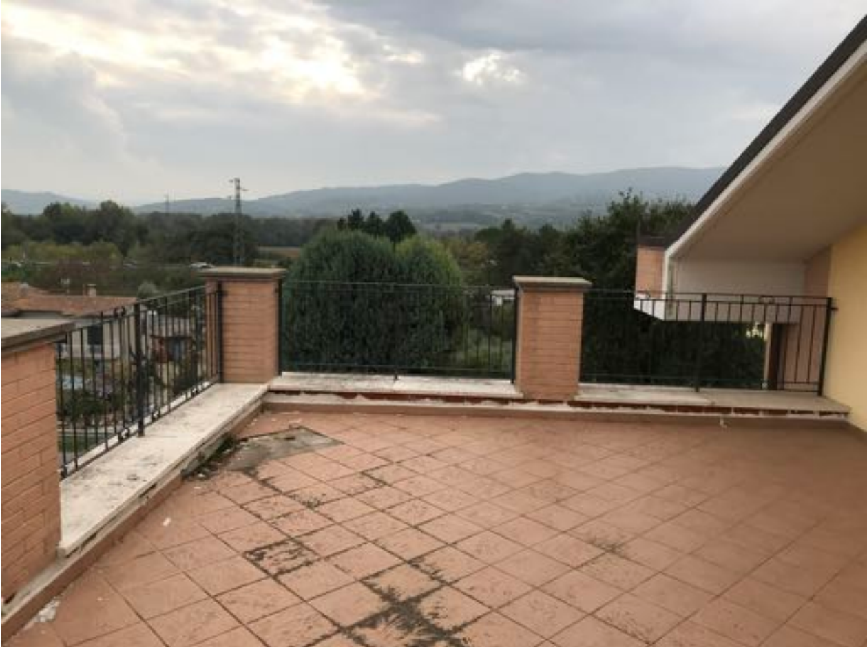
Piano Secondo Immobile in corso di costruzione – Todi