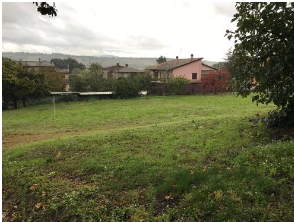
Terreno sito in Via Fratelli Cervi – Fratta Todina