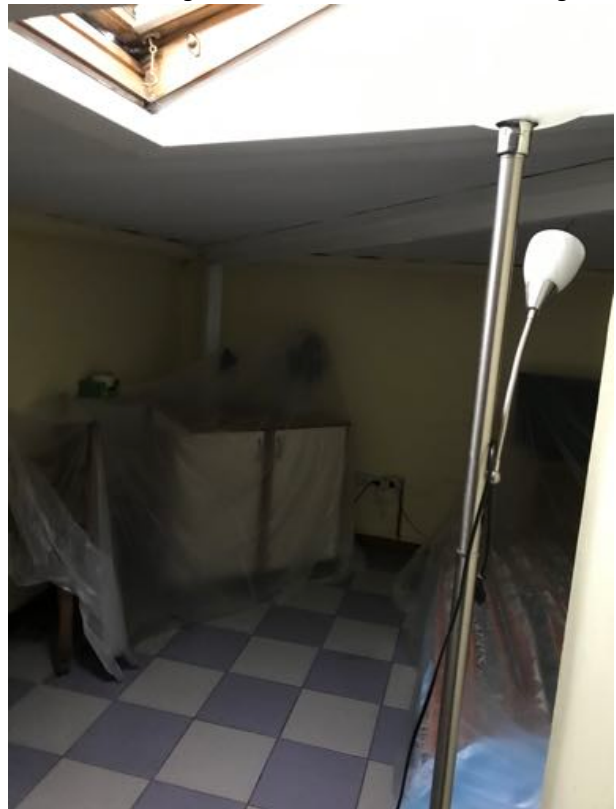
Mansarda/Magazzino sito in Via Settevalli – Perugia