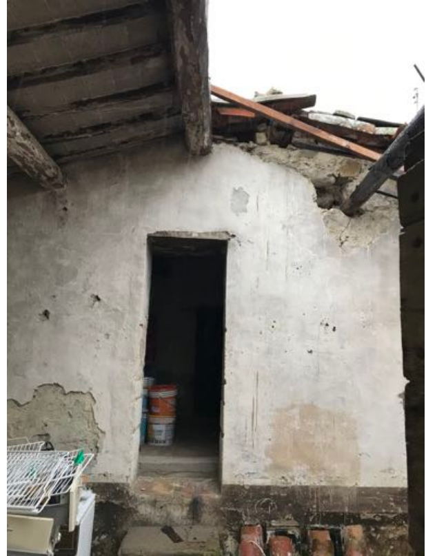
Immobilе sito in Via Fratelli Cervi – Fratta Todina