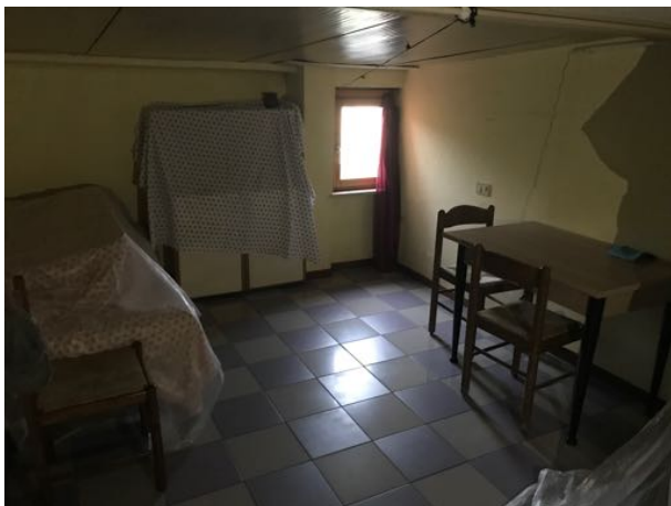
Mansarda/Magazzino sito in Via Settevalli – Perugia