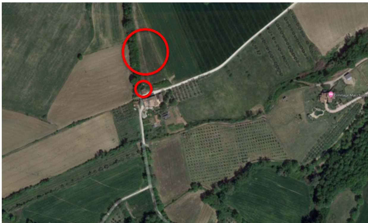
Foto aerea individuazione immobile e terreni siti in Fratta Todina Loc. Macchiabella