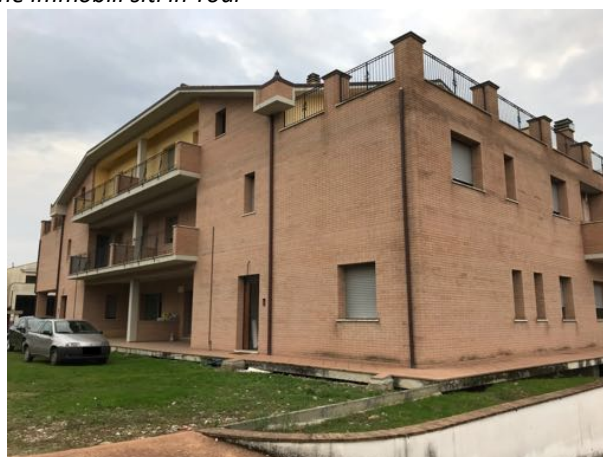
Esterno Immoblie in corso di costruzione – Todi