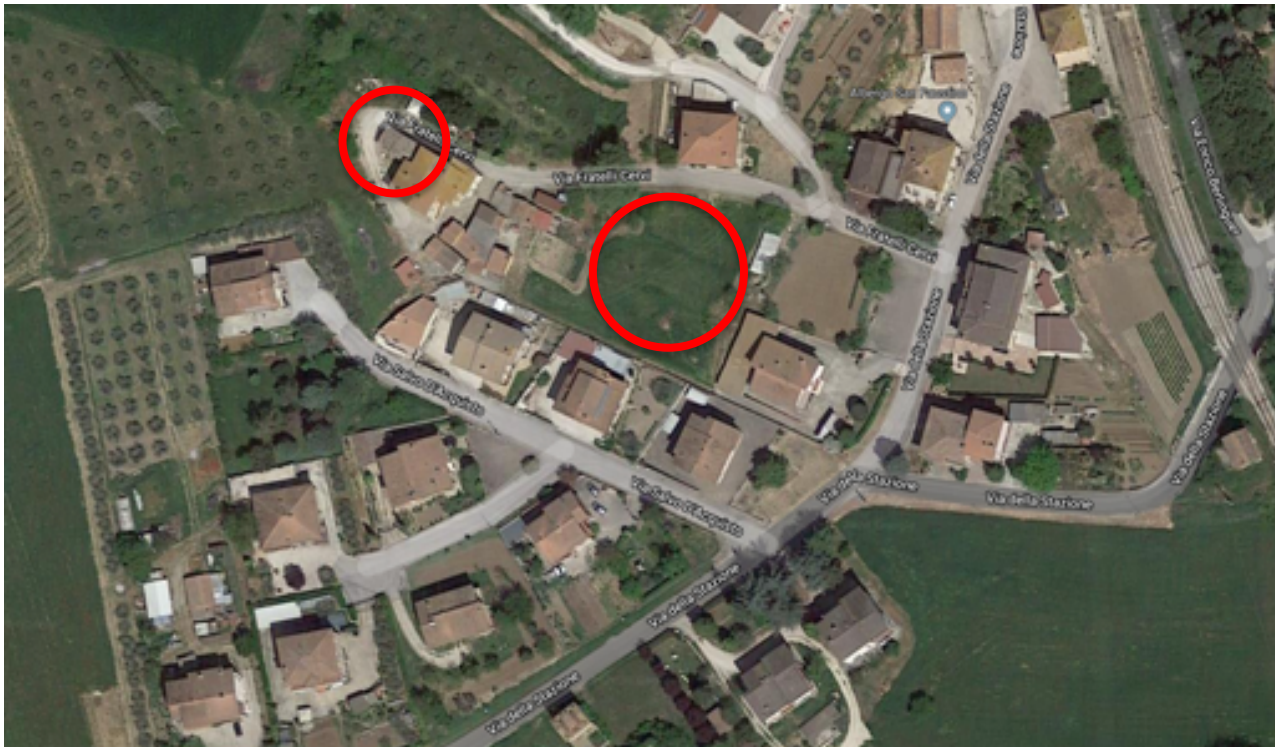
Foto aerea individuazione immobile e terreni siti in Fratta Todina Via Fratelli Cervi