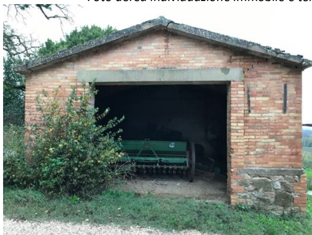
Immobilabile sito in Loc. Macchiabella – Fratta Todina