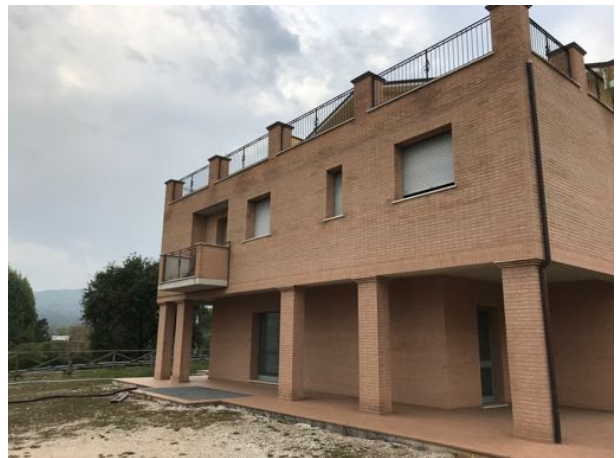
Esterno Immobile in corso di costruzione – Todi