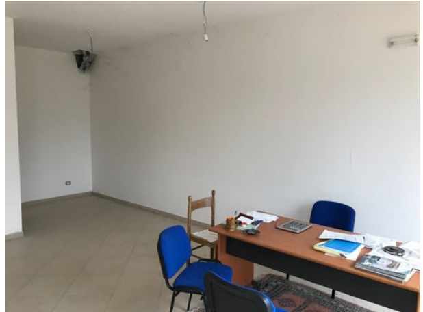
Piano Terra Immobile in corso di costruzione – Todi