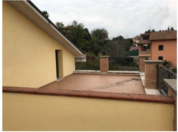
Piano Secondo Immobile in corso di costruzione – Todi