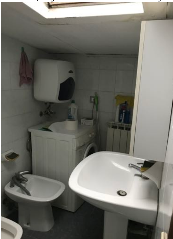
Mansarda/Magazzino sito in Via Settevalli – Perugia