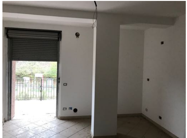
Piano Primo Immobile in corso di costruzione – Todi