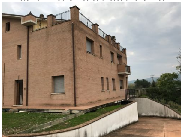
Esterno Immoblie in corso di costruzione – Todi