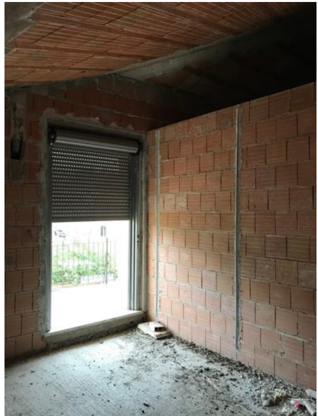
Piano Secondo Immobile in corso di costruzione – Todi