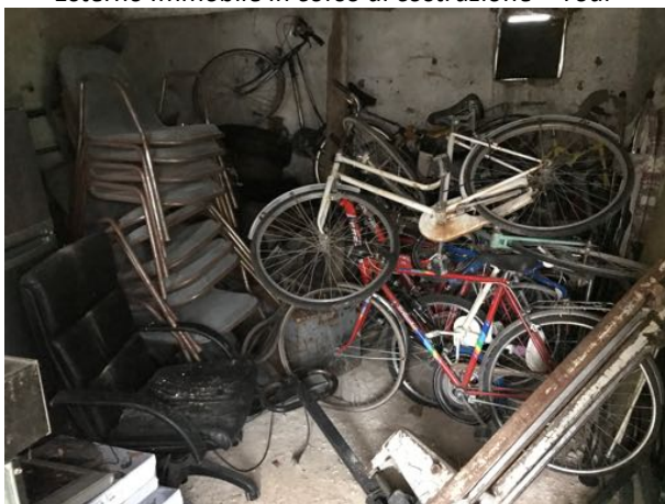
Piano Seminterrato Immobile in corso di costruzione – Todi