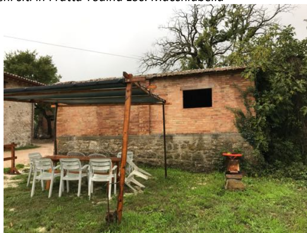
Immobilabile sito in Loc. Macchiabella – Fratta Todina