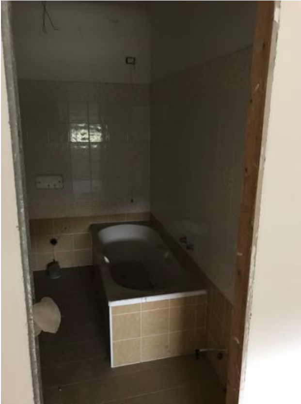
Piano Primo Immobile in corso di costruzione – Todi