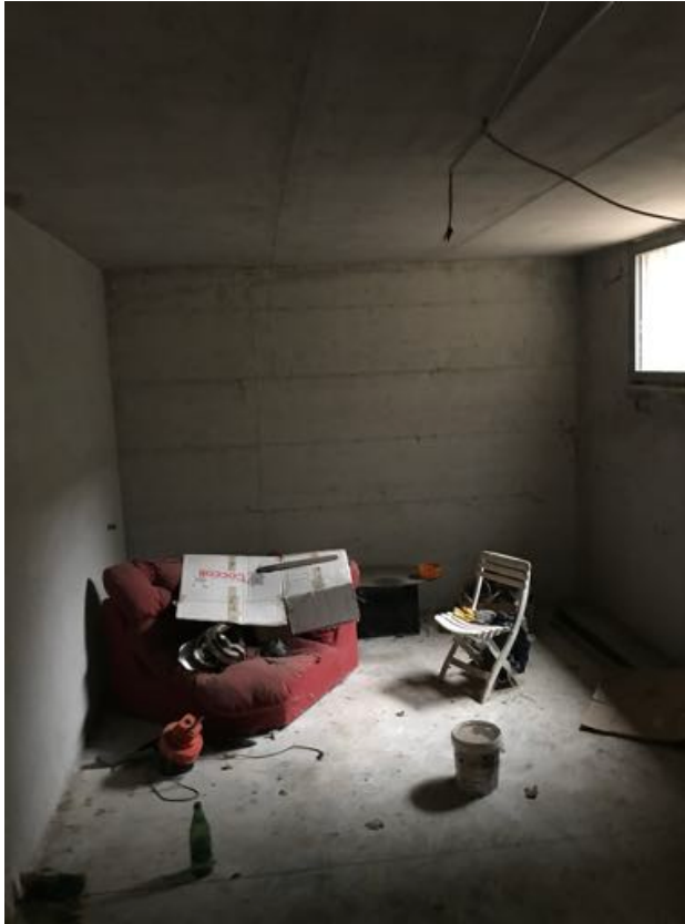
Piano Seminterrato Immobile in corso di costruzione – Todi