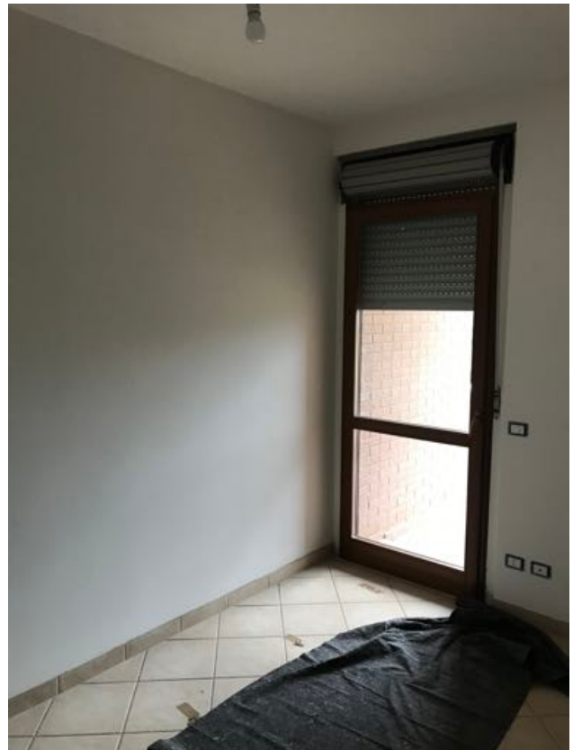
Piano Primo Immobile in corso di costruzione – Todi