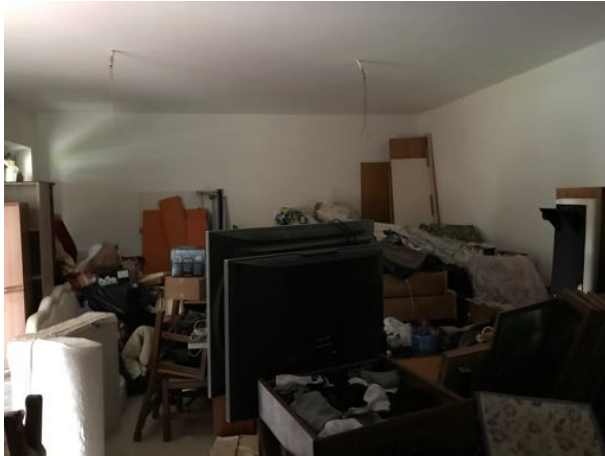
Piano Terra Immobile in corso di costruzione – Todi