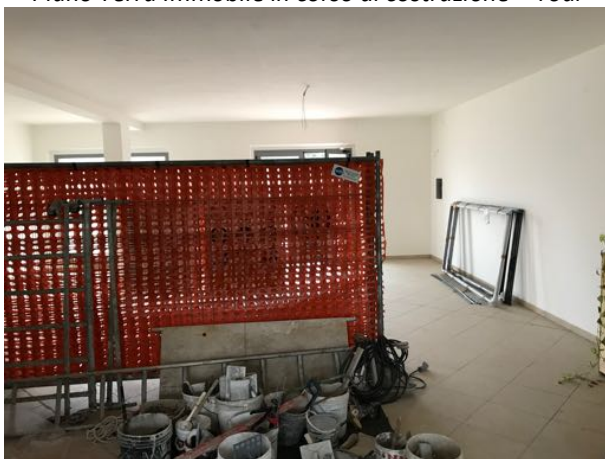
Piano Terra Immobile in corso di costruzione – Todi