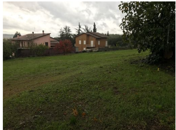
Terreno sito in Via Fratelli Cervi – Fratta Todina