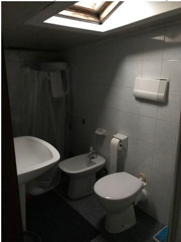
Mansarda/Magazzino sito in Via Settevalli – Perugia