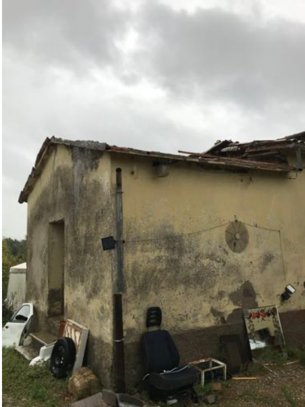
Immobilе sito in Via Fratelli Cervi – Fratta Todina