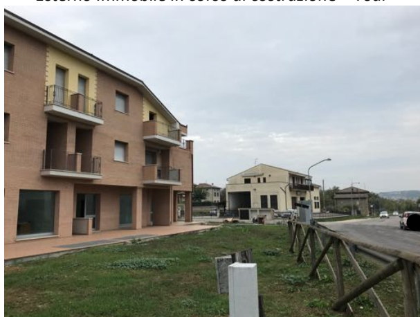
Esterno Immoblie in corso di costruzione – Todi