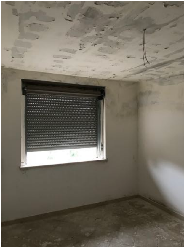
Piano Primo Immobile in corso di costruzione – Todi