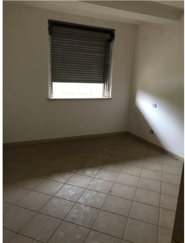
Piano Primo Immobile in corso di costruzione – Todi