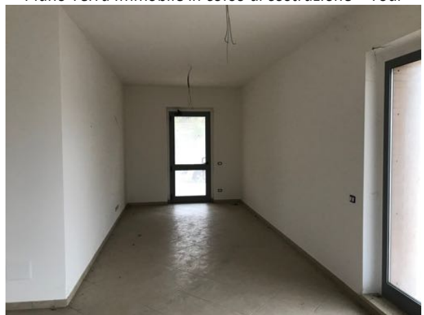
Piano Terra Immobile in corso di costruzione – Todi