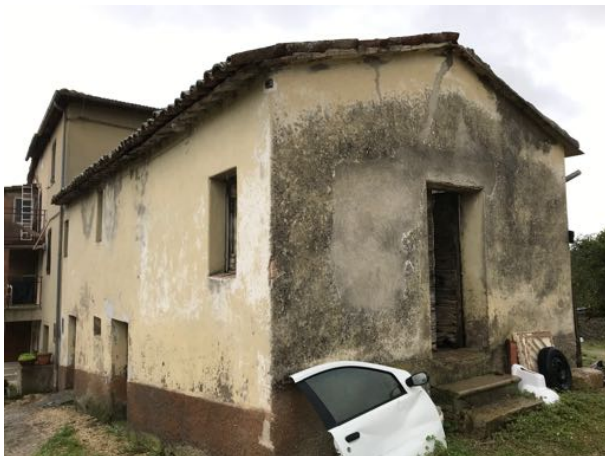
Immobile sito in Via Fratelli Cervi – Fratta Todina