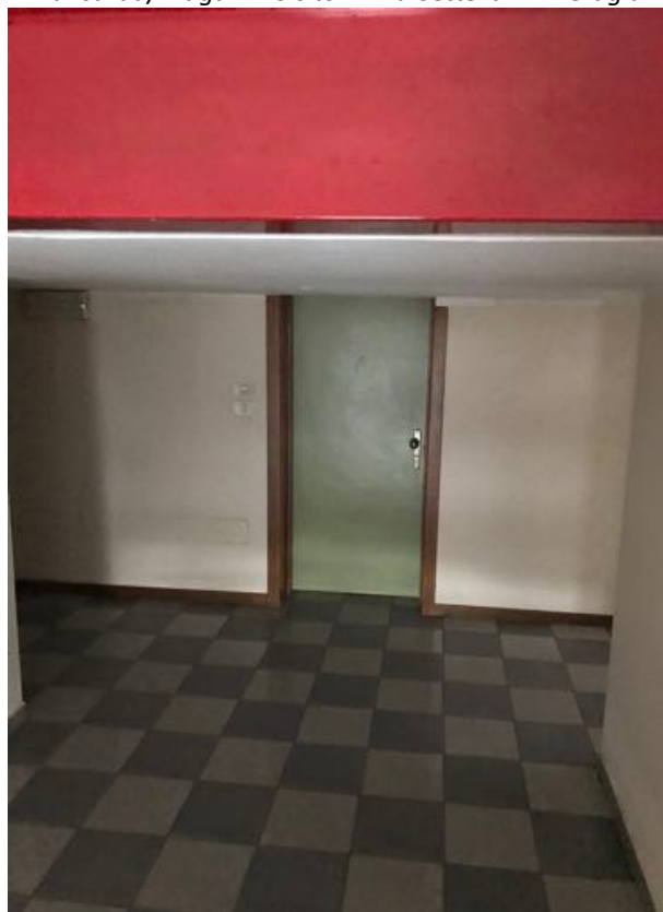
Mansarda/Magazzino sito in Via Settevalli – Perugia