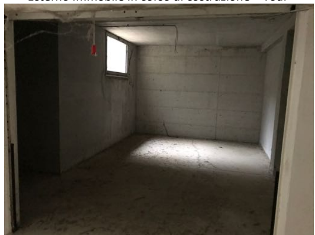
Piano Seminterrato Immobile in corso di costruzione – Todi