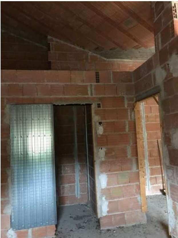
Piano Secondo Immobile in corso di costruzione – Todi