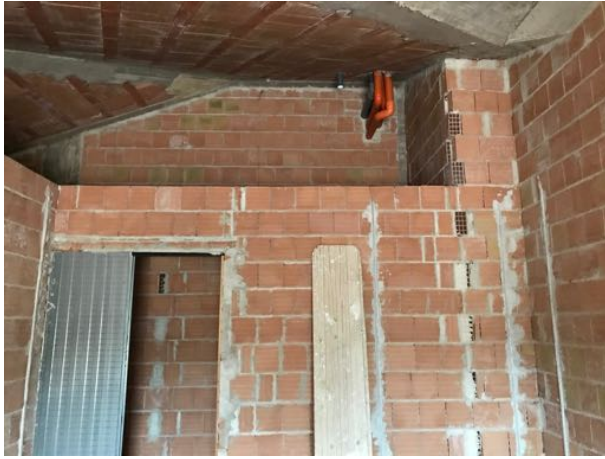
Piano Secondo Immobile in corso di costruzione – Todi