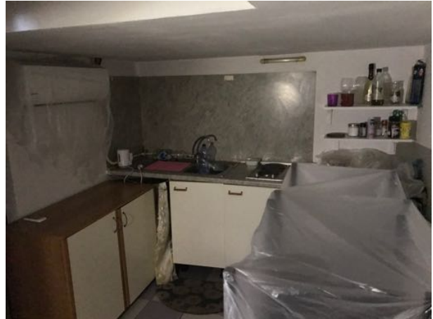
Mansarda/Magazzino sito in Via Settevalli – Perugia