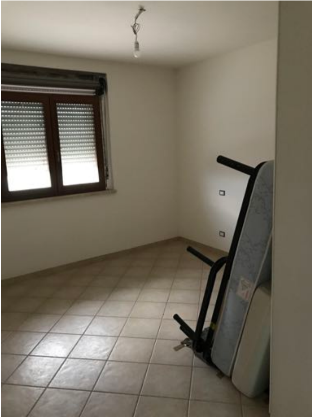
Piano Primo Immobile in corso di costruzione – Todi