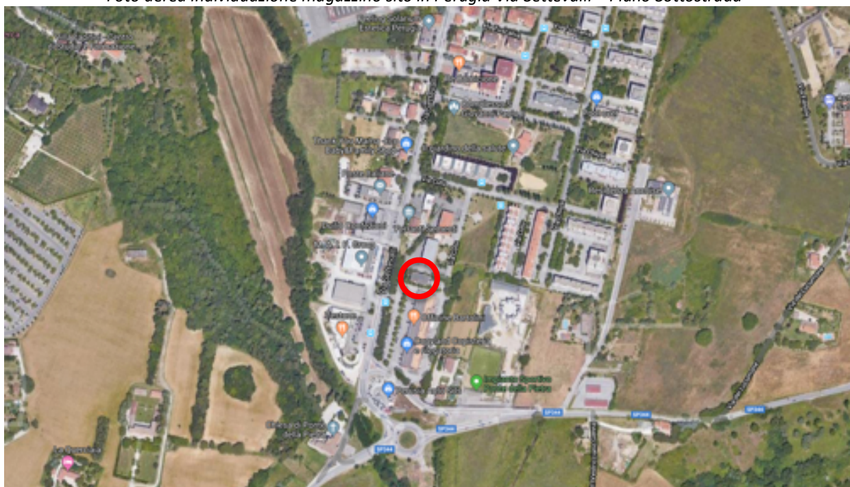
Foto aerea individuazione magazzini siti in Perugia Via Settevalli n.496 – Piano Terzo