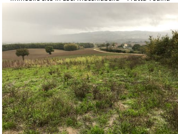
Terreno sito in Loc. Macchiabella – Fratta Todina