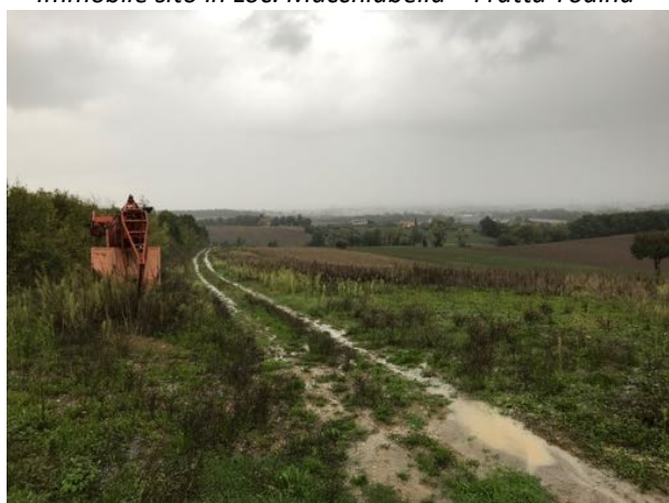
Terreno sito in Loc. Macchiabella – Fratta Todina