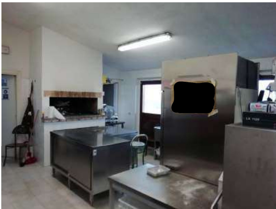
Foto n. 19: Vista parte locale cucina (locale n.9 nella planimetria di cui all'allegato 4) con vista della zona sottostante e porta d'ingresso sul prospetto retrostante di cui alla foto n. 7