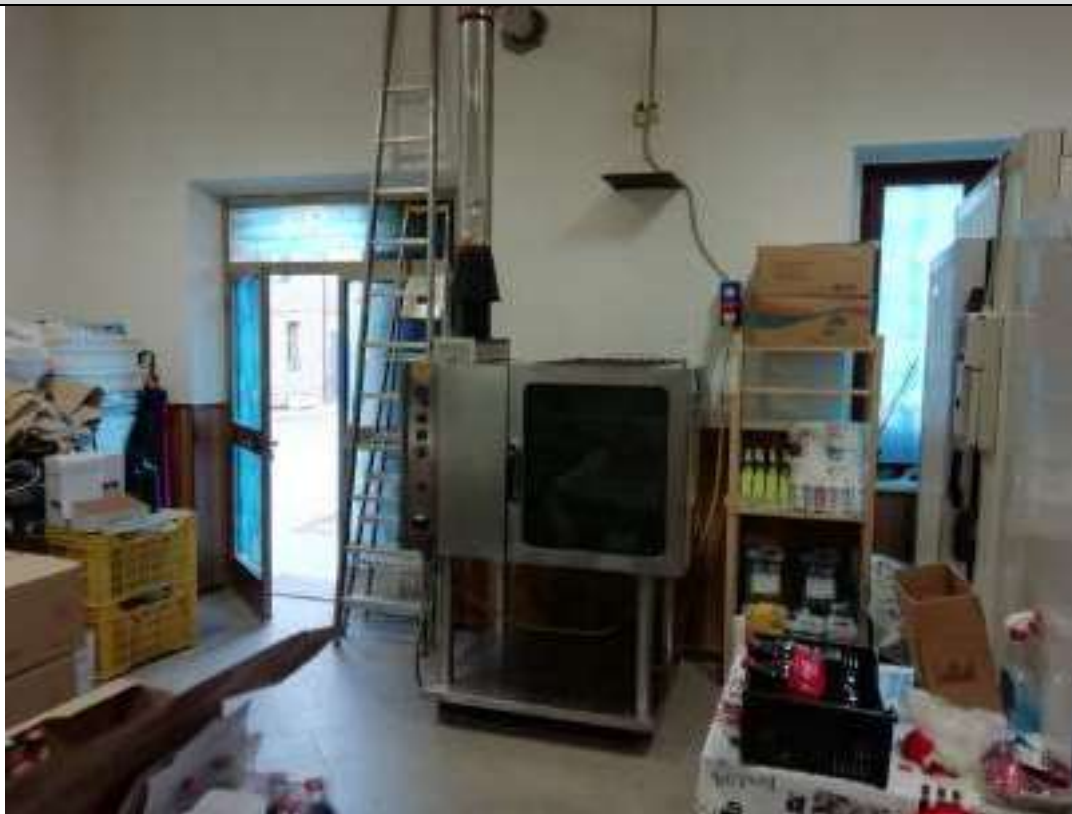
Foto n. 21: Vista del locale (locale n. 14 nella planimetria di cui all'allegato 4) dalla zona d'ingresso sul prospetto laterale di cui alla foto n.5