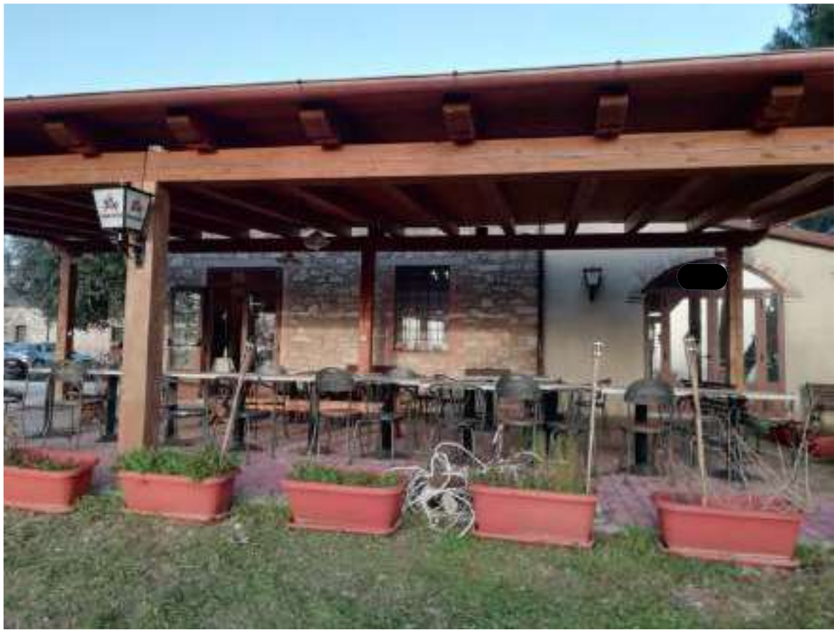
Foto n. 8 – Vista del prospetto laterale, lungo la strada provinciale, con ingressi alle sale ristoranti, con struttura in legno esterna non censita.