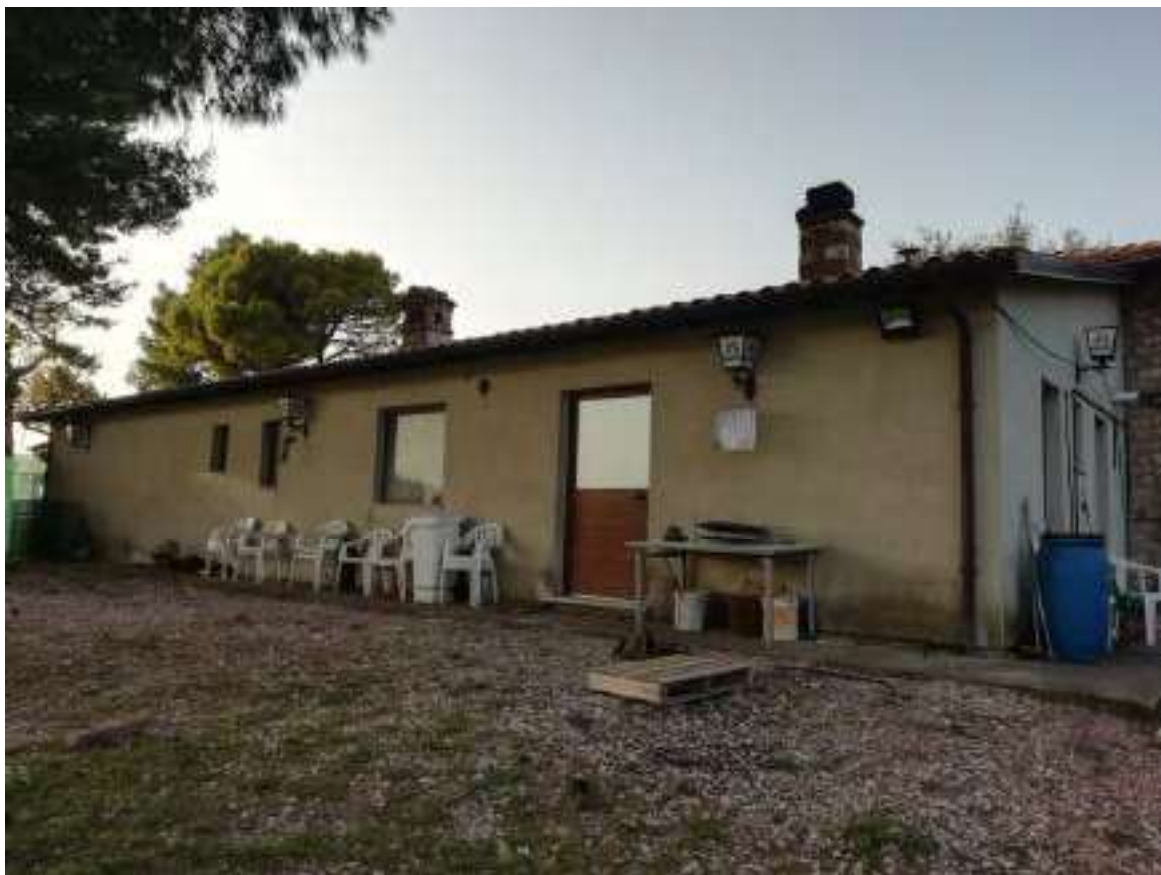
Foto n. 7 – Vista generale del prospetto restaurant con porta d'ingresso diretta al locale cucina