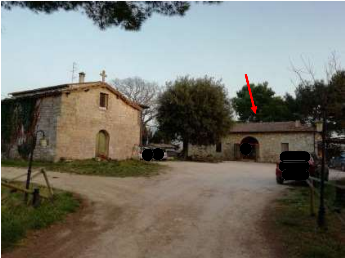
Foto n. 2 – Vista dall'ingresso della proprietà della corte (sub 1) delle unità immobiliari oggetto di esecuzione (indicato dalla freccia rossa)