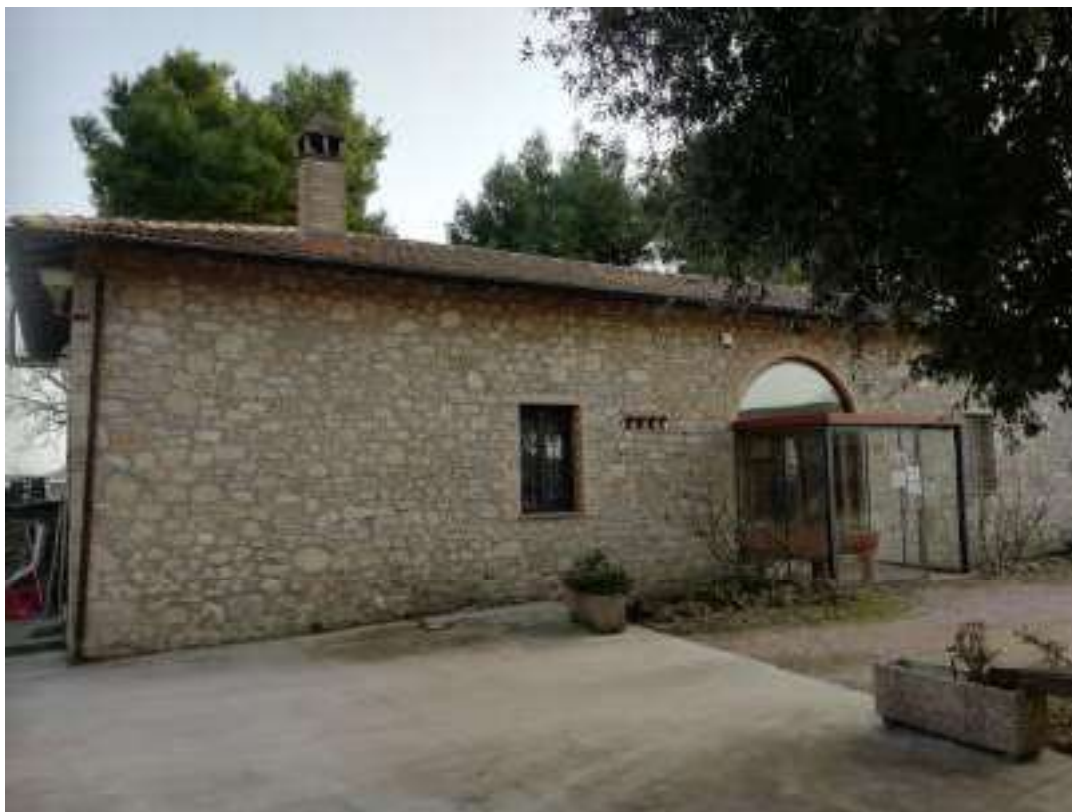
Foto n. 4 – Vista particolare del prospetto lato ingresso (finestra appartenente all'unità immobiliare censita come abitazione di cui al sub 10, ma in realtà utilizzata come magazzino del ristorante come da planimetrie di rilievo allegate (Allegato 4)