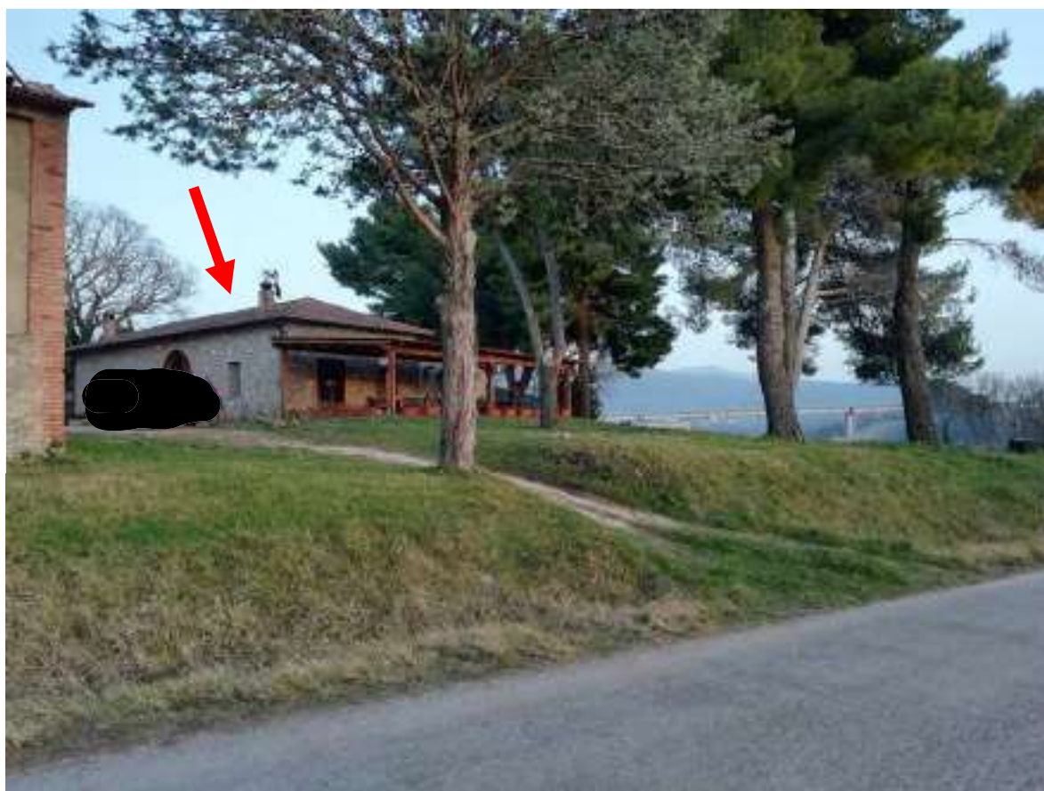
Foto n. 1 – Vista dalla strada provinciale 421 delle unità immobiliari oggetto di esecuzione (indicato dalla freccia rossa)