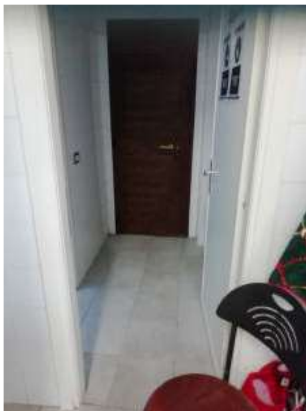
Foto n. 20: Vista ingresso di servizio dal prospetto laterale di cui alla foto n. 6 (locale n. 12 nella planimetria di cui all'allegato 4)