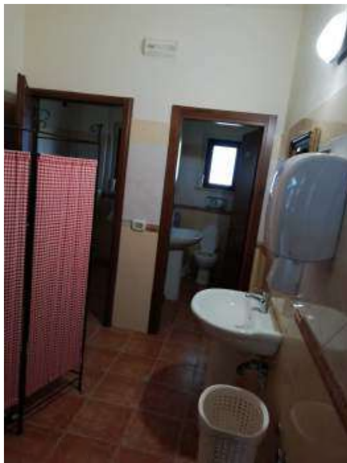
Foto n. 17: Vista generale dei locali igienici principali (locali n.6-7-8 nella planimetria di cui all'allegato 4)