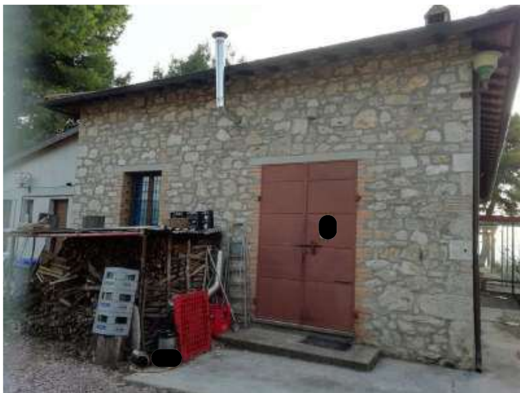
Foto n. 5 – Vista prospetto laterale con particolare ingresso dell'unità immobiliare censita come abitazione di cui al sub 10, ma in realtà utilizzata come magazzino del ristorante come da planimetrie di rilievo allegate (Allegato 4)