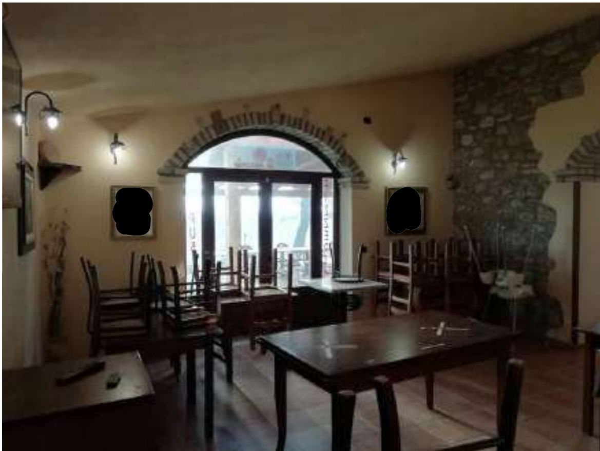
Foto n. 13: Vista generale sala ristorante (locale n.1 nella planimetria di cui all'allegato 4) con ingresso dal prospetto laterale di cui alla foto n.8