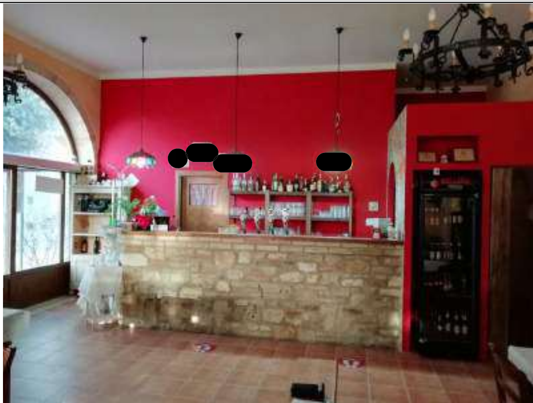
Foto n. 9 – Vista bancone sala ristorante (locale n.2 nella planimetria di cui all'allegato 4) con ingresso laterale dalla corte.

Foglio 1 Particella 26 Sub 11 - PIANO TERRA