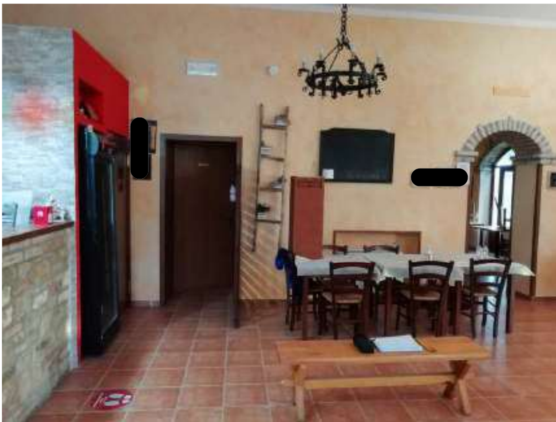
Foto n. 12: Vista della sala ristorante (locale n.2 nella planimetria di cui all'allegato 4) con vista porta d'ingresso ai locali igienici