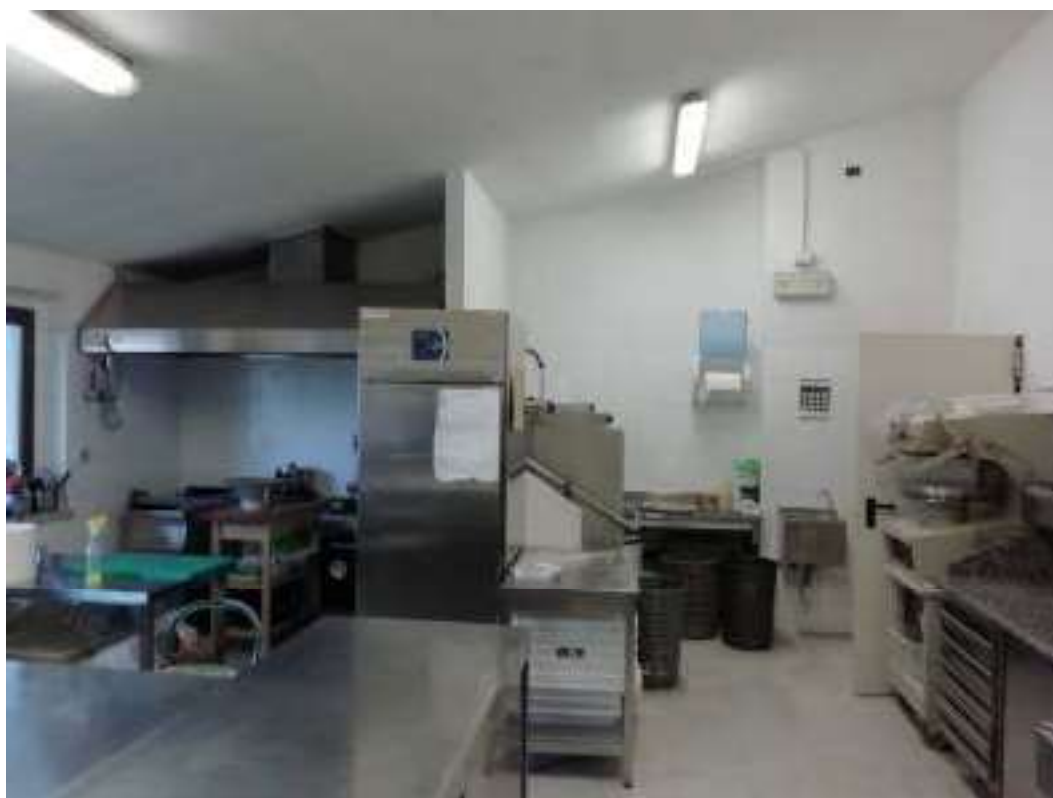
Foto n. 18: Vista parte locale cucina (locale n.9 nella planimetria di cui all'allegato 4) con porta sulla destra comunicante con il disimpegno per la sala ristorante