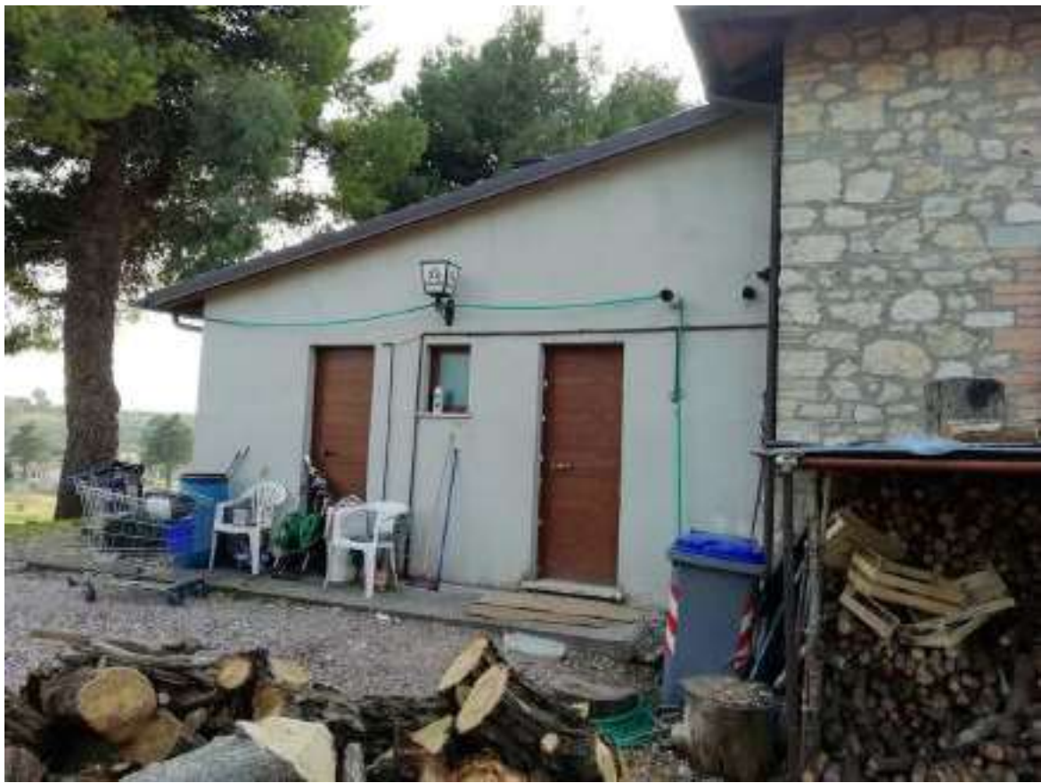
Foto n. 6 – Vista prosecuzione del prospetto laterale di cui alla foto precedente con ingresso di servizio del ristorante