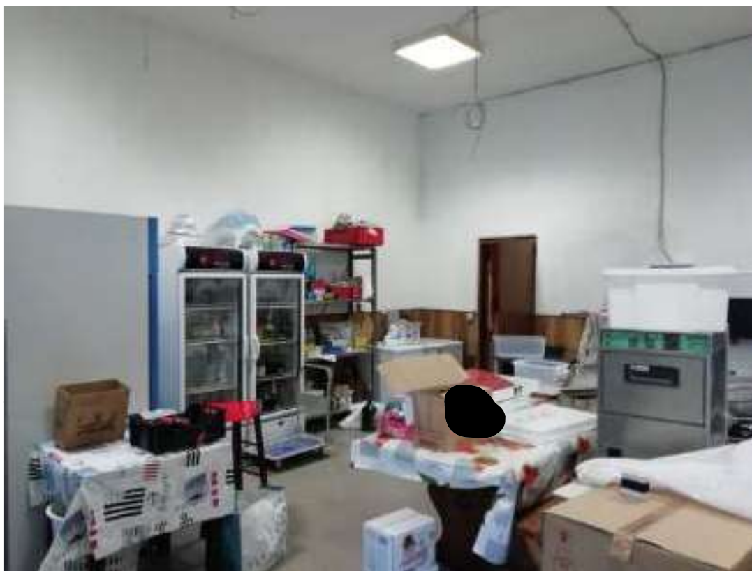
Foto n. 22: Vista verso la zona d'ingresso al disimpegno che immette alle sale ristorante e al locale cucina