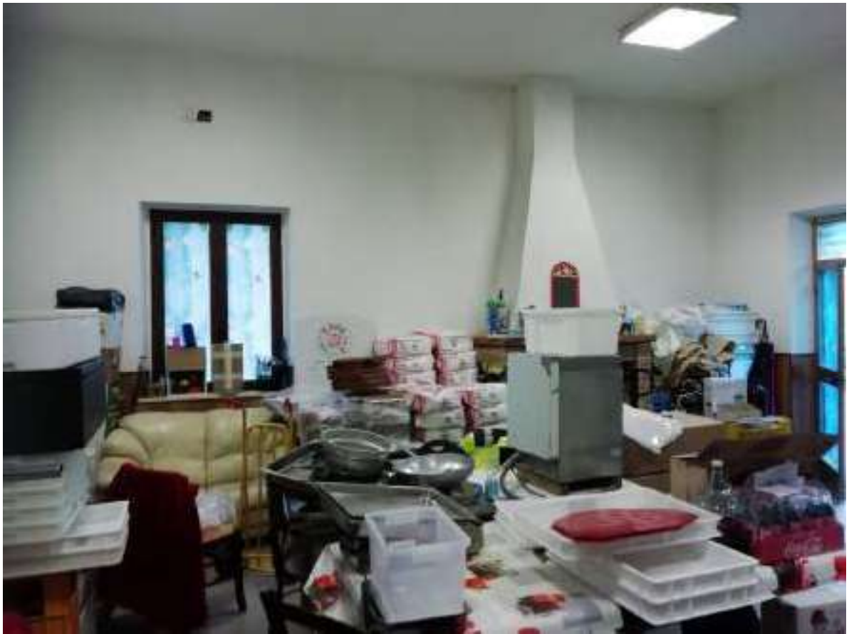
Foto n. 23: Vista parete laterale che affaccia sulla corte del fabbricato (finestra visibile all'esterno nella foto n. 4