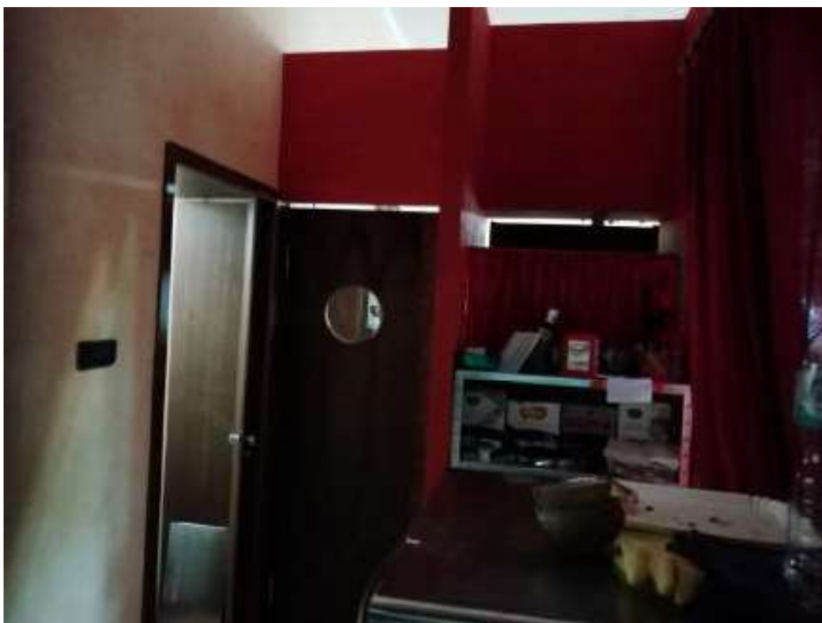
Foto n. 16: Vista del locale disimpegno (locale n.4 nella planimetria di cui all'allegato 4)