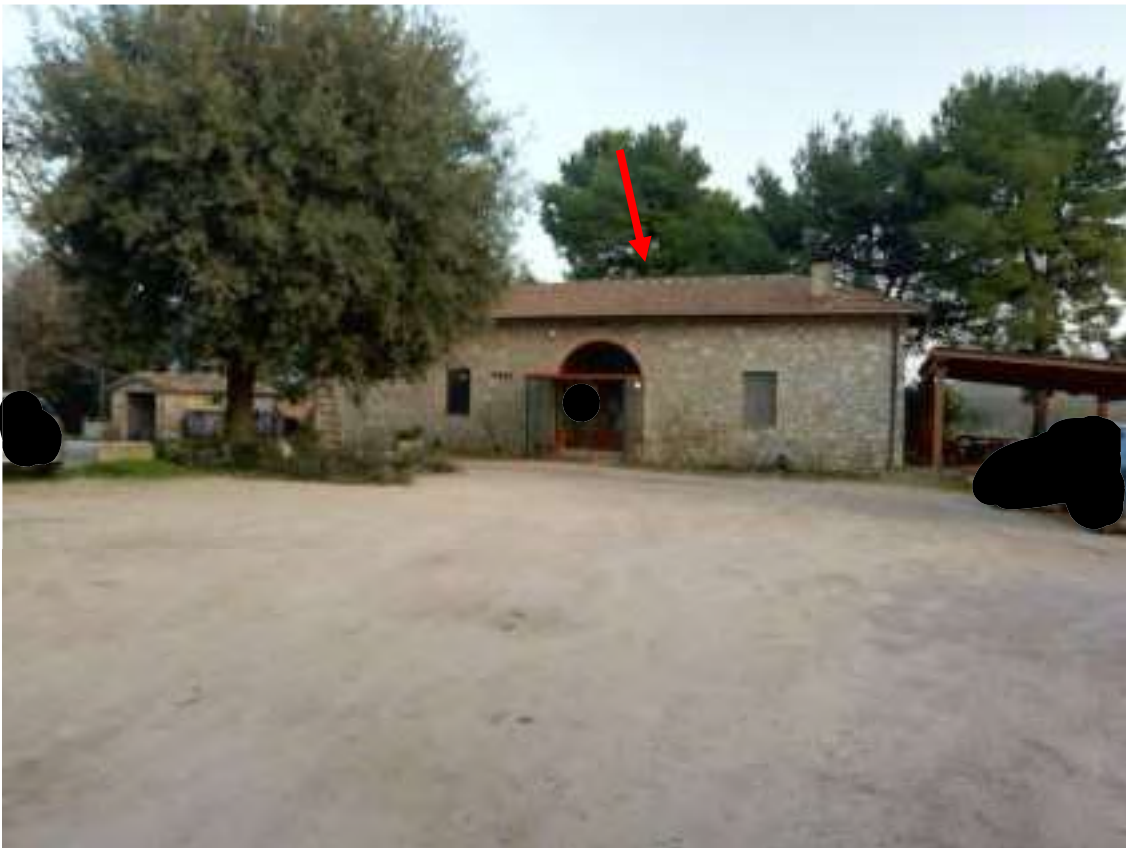
Foto n. 3 – Vista particolare dalla corte delle unità immobiliari oggetto di esecuzione (indicato dalla freccia rossa)