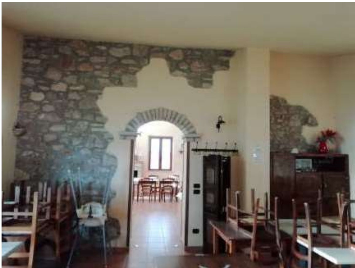
Foto n. 15: Vista ingresso della sala ristorante (locale n.1 nella planimetria di cui all'allegato 4) all'altra sala ristorante precedentemente documentata