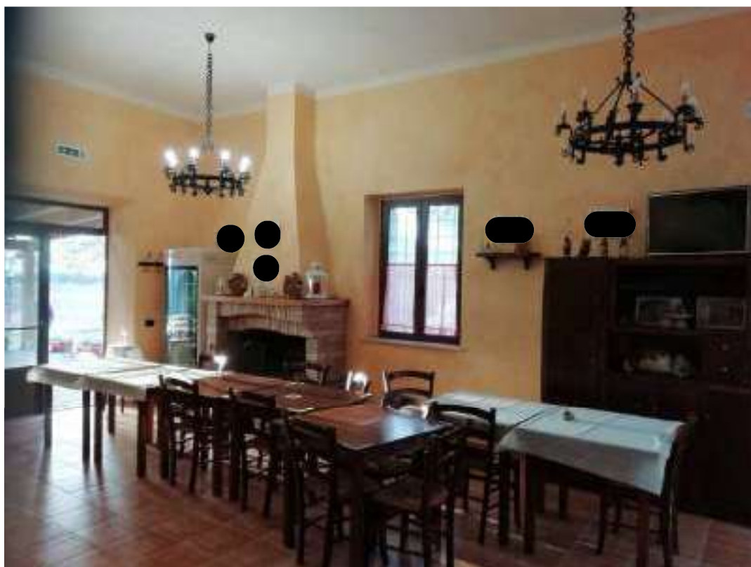
Foto n. 10 – Vista generale sala ristorante (locale n.2 nella planimetria di cui all'allegato 4) con ingresso dal prospetto laterale di cui alla foto n.8