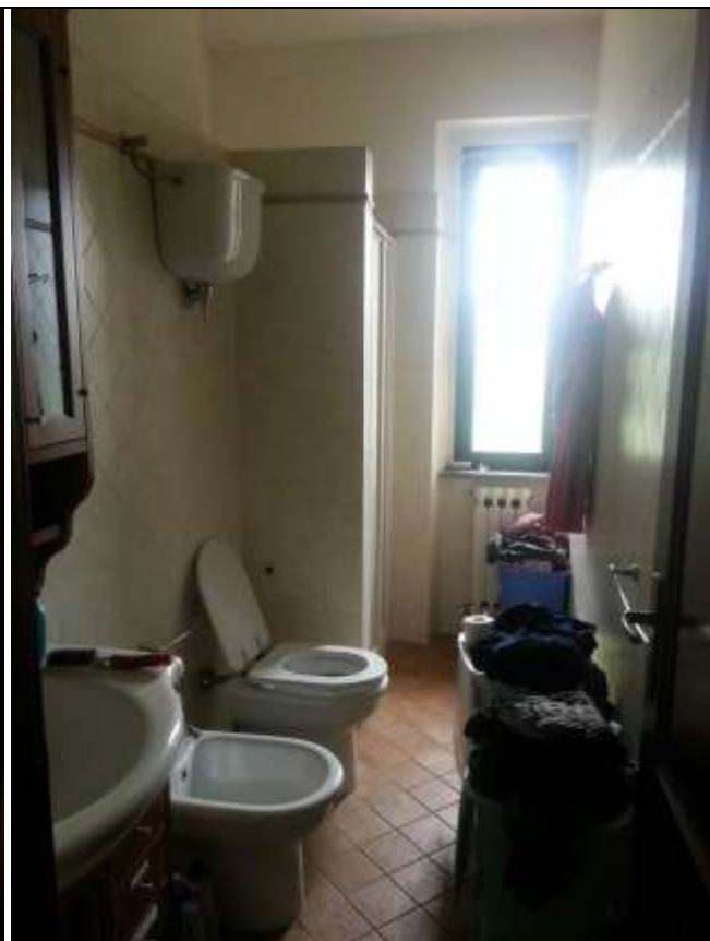
Foto 13-14 – Piano primo. Disimpegno e bagno. In ROSSO è indicata la scala interna. In BLU la porta d'entrata nella Camera 1.