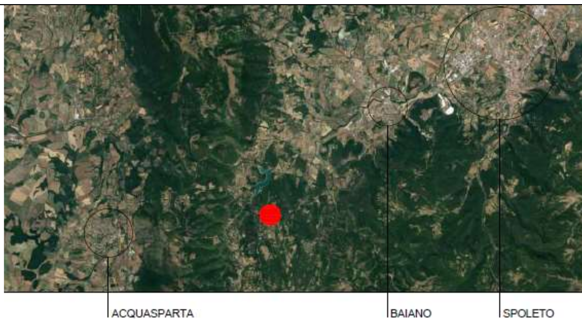
Foto 1 – Posizione delle unità immobiliari pignorate rispetto ai Comuni di Acquasparta e Spoleto.