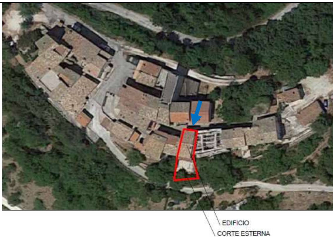
Foto 2 – In ROSSO il compendio pignorato. In BLU è indicata la posizione dell'ingresso nel centro abitato di Fogliano.