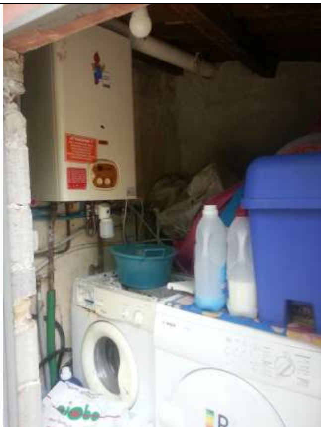
Foto 31-32 – Corte esterna al piano seminterrato. Casottino di servizio nel cui interno è ubicata la caldaia funzionante a gas metano dell'impianto termo-sanitario.