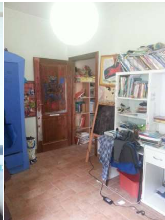
Foto 17-18 – Piano primo. Disimpegno e camera 2 (in fondo). In ROSSO è indicata la scala interna.