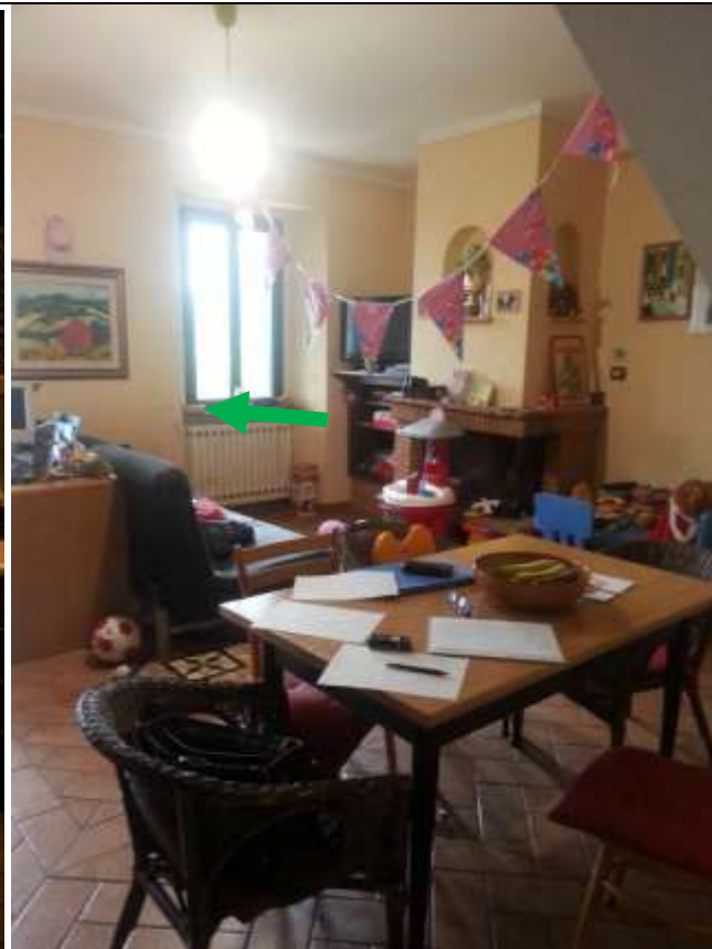
Foto 9-10 – Piano terra. Passaggio tra ingresso/cucina e soggiorno.