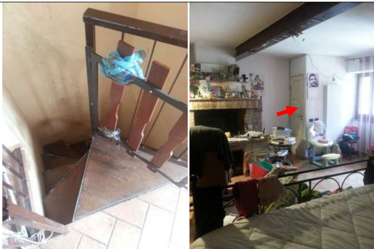
Foto 21-22 – Scala a chiocciola che dal soggiorno conduce nella camera al piano seminterrato. Vista della camera. In ROSSO è indicata la porta del vano scala.