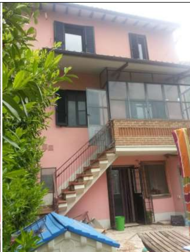
Foto 29-30 – Corte esterna al piano seminterrato. Scala esterna che conduce nella veranda e nel soggiorno del piano terra.