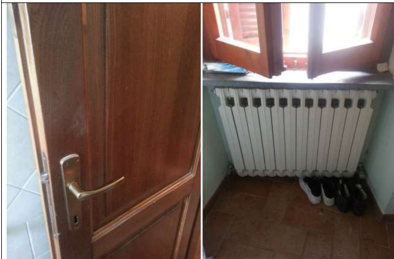
Foto 41-42 – Particolare delle porte interne e dei corpi radianti.