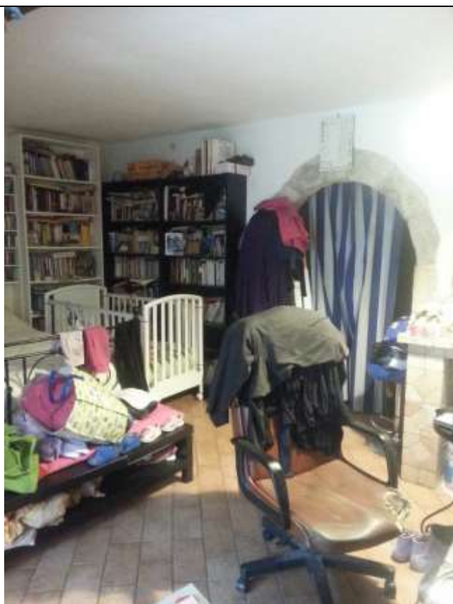
Foto 23-24 – Piano seminterrato. Camera e apertura del ripostiglio.