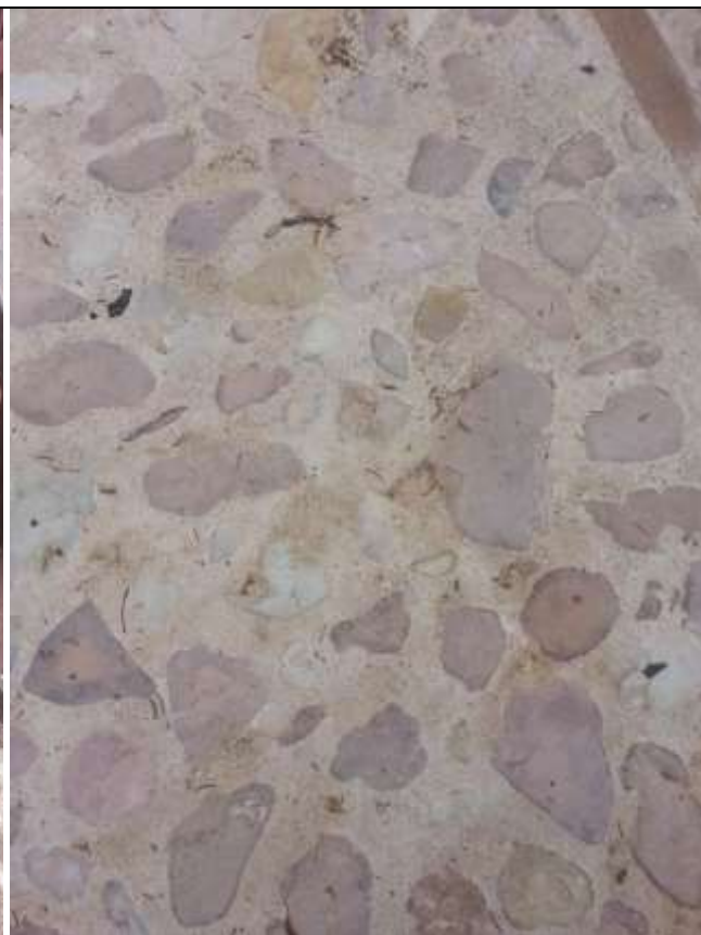
Foto 37-38 – Particolare della pavimentazione esterna. Rivestimento scala in cotto e selciato della corte.