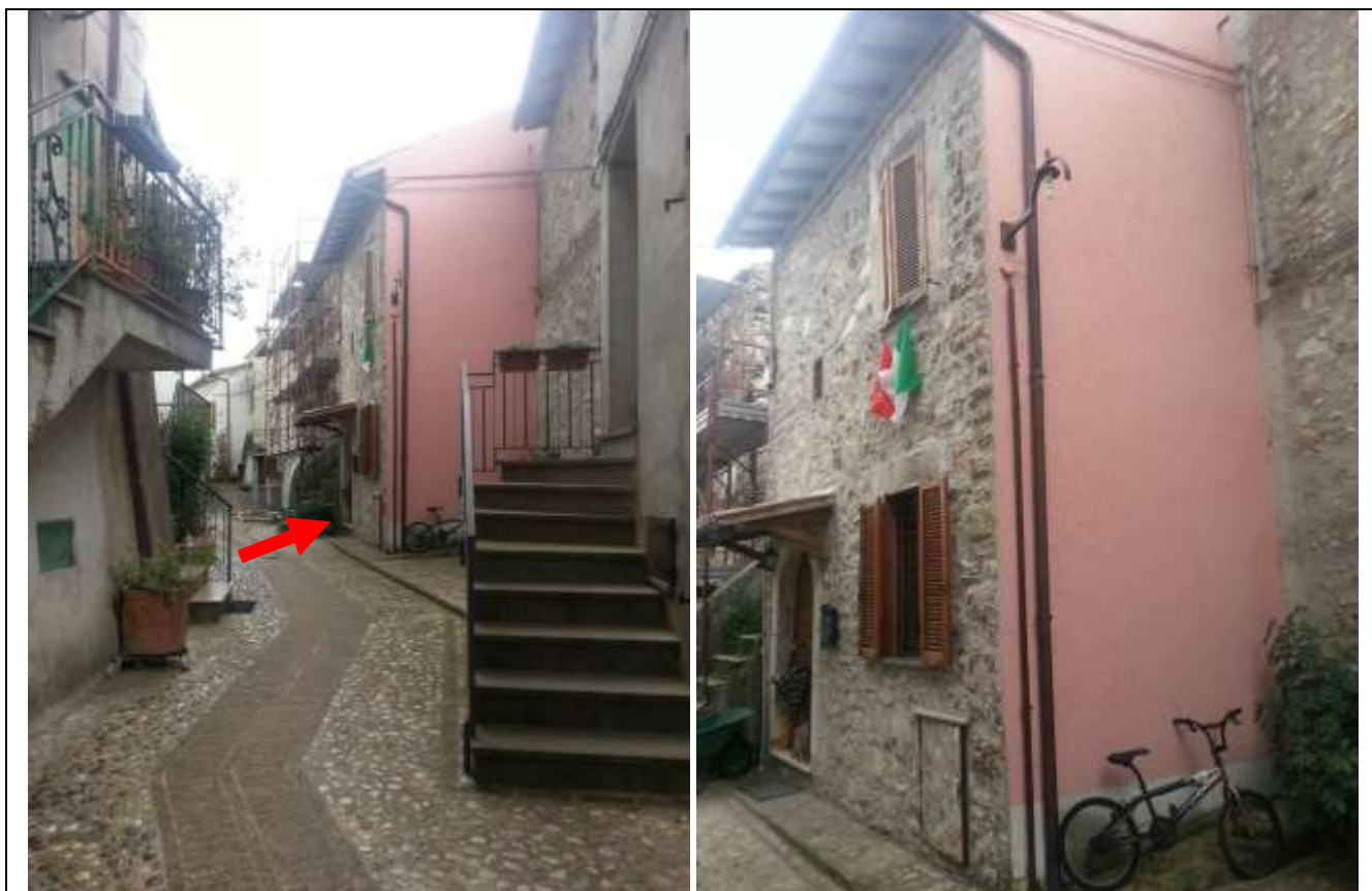
Foto 3-4 – Ingresso al piano terra nel centro abitato di Fogliano.