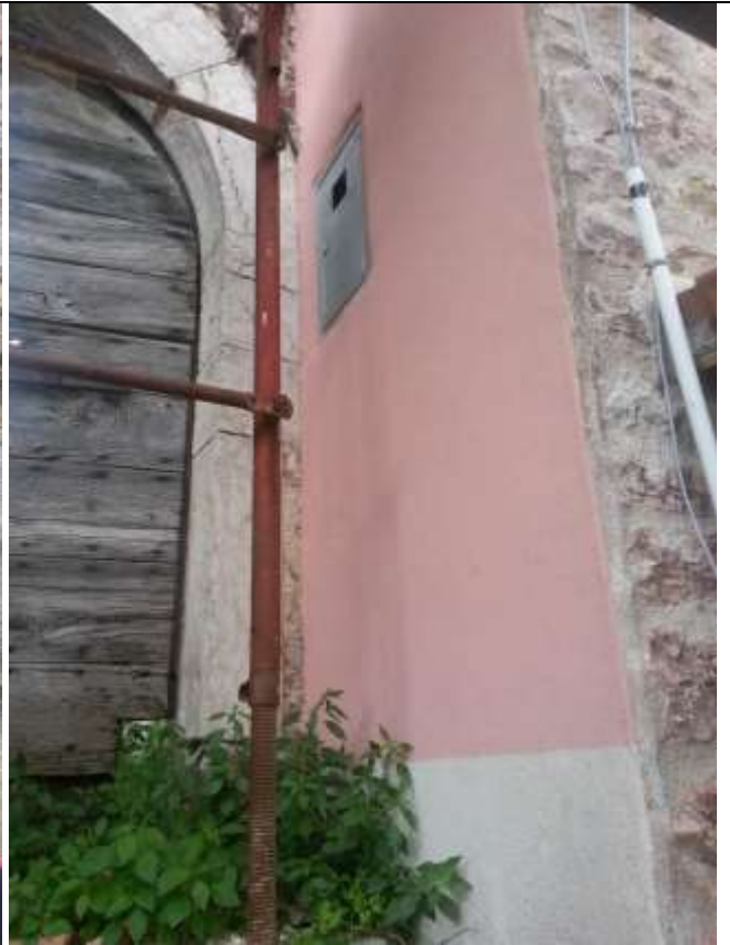
Foto 43-44 – Contatori del gas metano, dell'acqua e dell'elettricità.