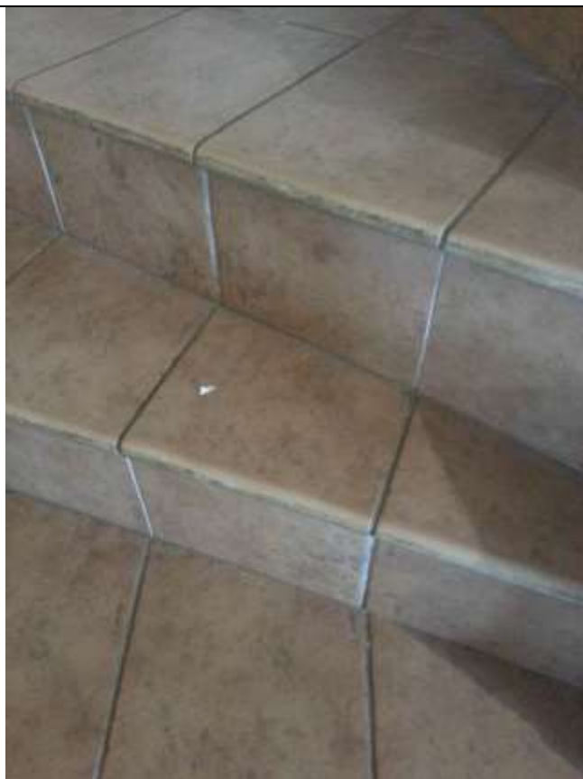
Foto 35-36 – Particolare della pavimentazione interna in cotto. Pavimento e rivestimento scala.